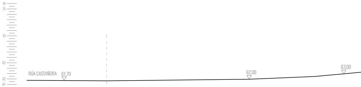
SECCIÓN RASANTE RÚA CASTAÑEIRAS