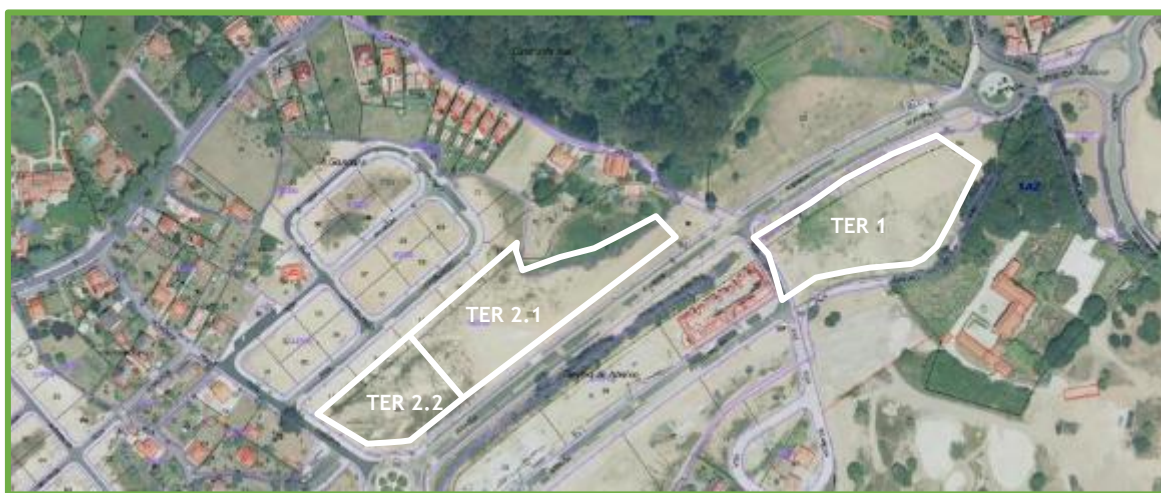
Imagen 4.1: Ámbito de actuación

Las parcelas TER 2.1 y TER 2.2 tienen como adjudicatario, cada una, una numerosa comunidad de titulares que engloba a aquellos propietarios minoritarios cuyas parcelas aportadas en origen no permitían por sí mismas, por sus limitados derechos de aprovechamiento, la adjudicación de una parcela resultante independiente en la adjudicación del Proyecto de Compensación. Esta circunstancia constituye una dificultad añadida al desarrollo de esta área del ámbito, de importancia estratégica para la dotación de usos terciarios en esta parte del Municipio.