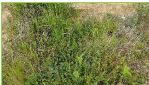
Foto 7.7. Formaciones herbáceas

Como se ha indicado, el terreno de las parcelas ha sido removido, donde crecen formaciones herbáceas y matorral bajo, siendo escasa la vegetación de porte arbóreo, donde destaca la presencia de algunos ejemplares jóvenes de sauce y aliso que crecen de forma espontánea