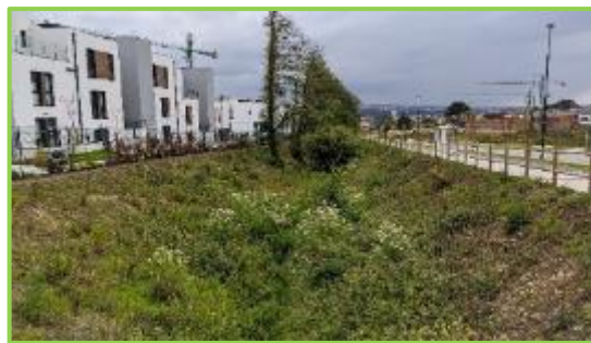
Foto 7.4. Rego de Xaz canalizado