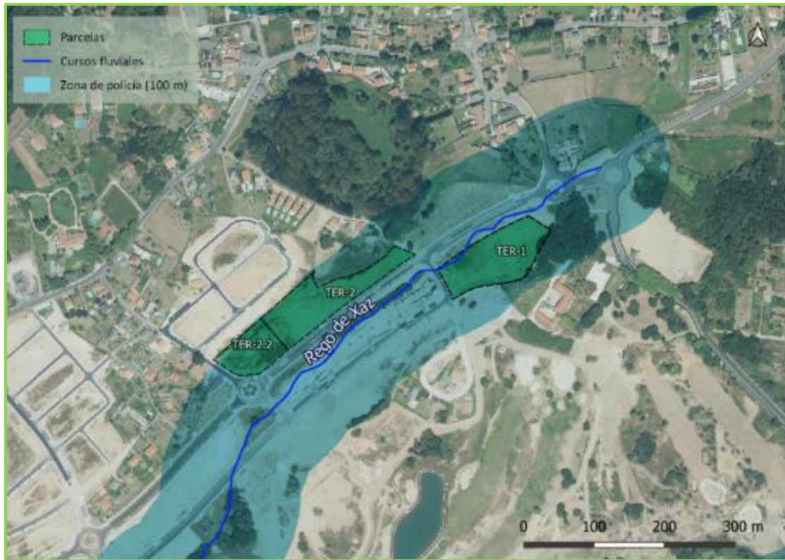
Imagen 7.1: Hidrología.

Como se puede ver en la imagen anterior, las parcelas objeto de estudio se localizan dentro de la zona de policía del cauce, incluso una de ellas invadiría la zona de servidumbre (5m)