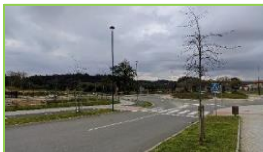
Foto 7.11. Entorno parcela TER-2.2