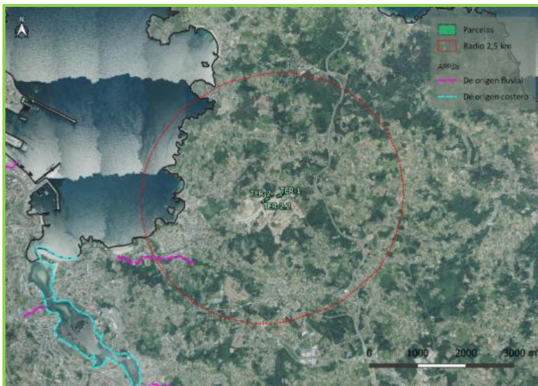
Imagen 7.2: ARPSIs.

En relación a este rego de Xaz, éste se canaliza resolviendo el problema de la inundabilidad de la zona en la actualidad. Se recuperan y catalogan además dos fuentes y dos lavaderos existentes en la proximidad del regato dada su relación directa con él y su estado de conservación.