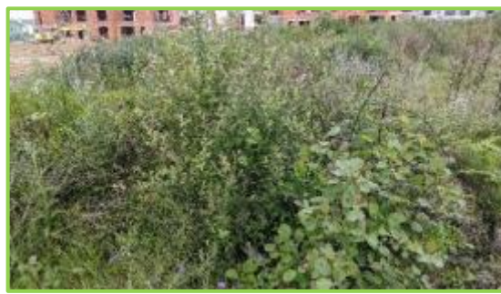
Foto 7.8. Alisos y sauces creciendo en la parcela TER-2.2

La vegetación de ribera es escasa, y está formada por alisos ( Alnus glutinosa ) y sauce cenizo ( Salix atrocinerea ) que se observan en los cauces del entorno.