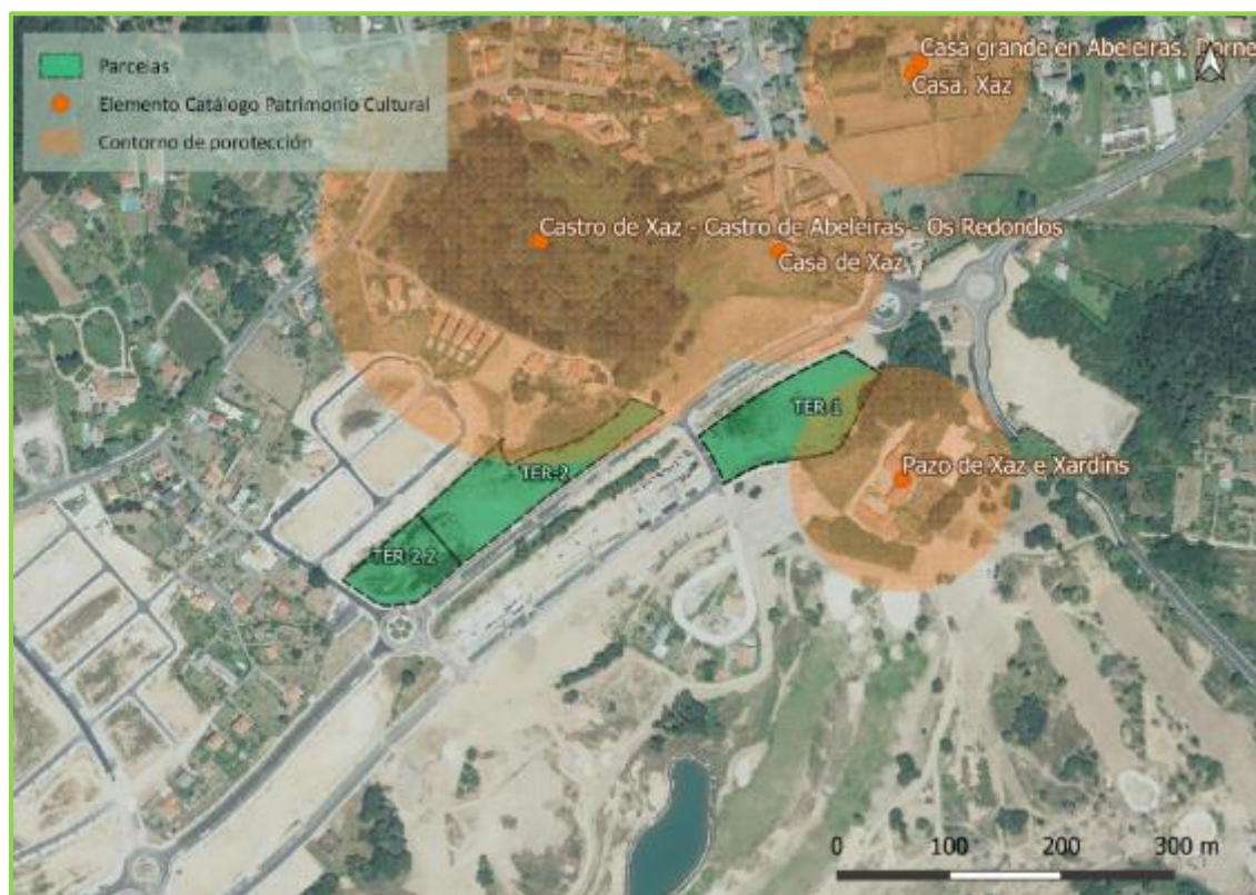
Imagen 7.4: Patrimonio cultural

Los elementos catalogados más cercanos dentro de este ámbito son los que se reflejan en la imagen siguiente: