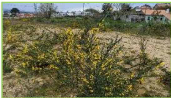
Foto 7.5. Retama

En la zona de actuación de la MODIFICACIÓN PUNTUAL Nº 2 predomina la vegetación herbácea y el matorral bajo, constituido principalmente por tojo ( Ulex europaeus ) y retama ( Cytisus scoparius ).