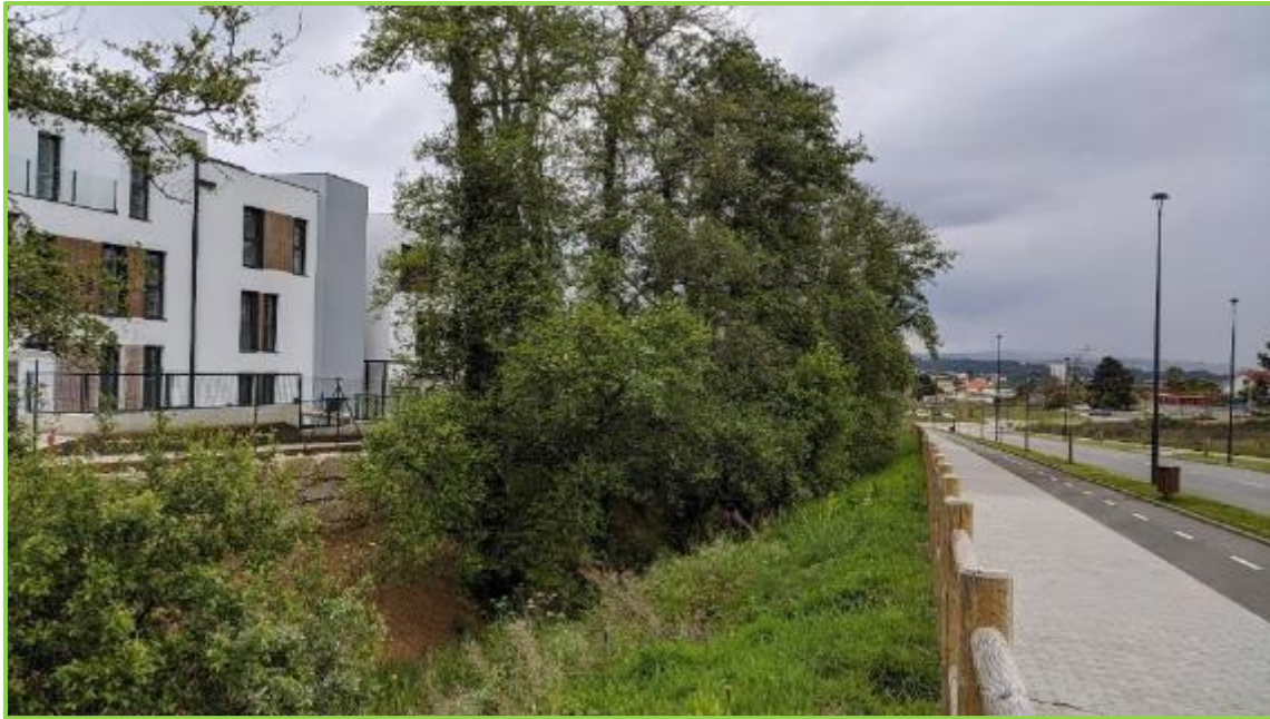
Foto 7.9. Vegetación de ribera escasa en el cauce del Rego de Xaz, al sur de las parcelas TER-2.1 y TER-2.2

De acuerdo con la información recogida en el Banco de Datos de la Naturaleza del Ministerio de Agricultura y Pesca, Alimentación y Medio Ambiente (derivados de los trabajos del Atlas y Libro Rojo de la Flora Vascular Amenazada de España), y en la información del proyecto Anthos (Sistema de información sobre las plantas de España) se observa que no se cita para la cuadrícula 10x10 km 29TNH59 en la que se incluye el área de actuación ninguna especie florística protegida.