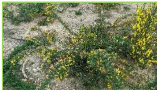
Foto 7.6. Tojos

Como se ha indicado, el terreno de las parcelas ha sido removido, donde crecen formaciones herbáceas y matorral bajo, siendo escasa la vegetación de porte arbóreo, donde destaca la presencia de algunos ejemplares jóvenes de sauce y aliso que crecen de forma espontánea