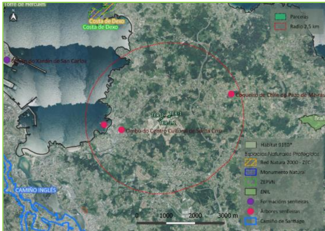
Imagen 7.3: Espacios protegidos y hábitat de interés.

El área de estudio se localiza dentro de la Reserva de la Biosfera “Mariñas Coruñesas e Terras do Mandeo” . Esta Reserva abarca un total de 116.724 ha (113.969,7 ha terrestres y 2.754,6 ha marinas), que representa el 14,33% de la superficie de la provincia de Coruña, repartidas en 17 ayuntamientos. Su creación tiene como principal objetivo el desarrollo del territorio, sus empresas y sus productos mediante marcas de calidad, recuperación de actividades tradicionales, oportunidades de empleo y formación, iniciativas turísticas y conservación de los recursos medioambientales.