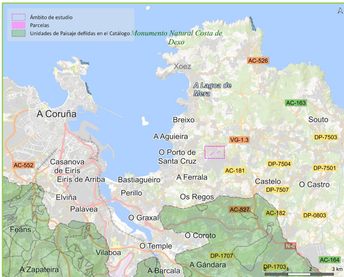
Imagen 9.5: Unidades de Paisaxe do Catálogo das Paisaxes de Galicia