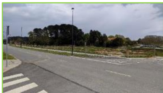
Foto 7.10. Entorno parcela TER-1

Así mismo, destacar que en la actualidad el entorno de la zona de actuación de la MODIFICACIÓN PUNTUAL Nº 2 está ya urbanizado, por lo que se ha transformado el paisaje, convirtiéndose en un entorno residencial de baja densidad.