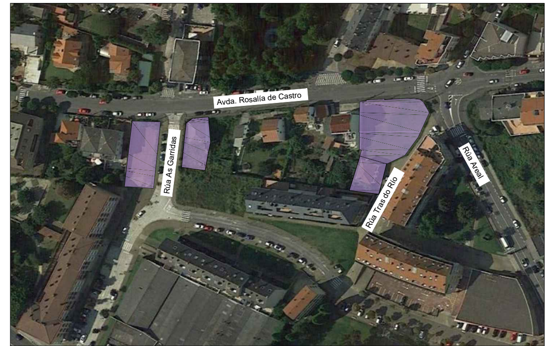
SITUACIÓN SOBRE ORTOFOTO