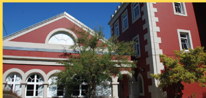
Centro Cultural As Torres Rúa Emilio Pardo Bazán, 17 Santa Cruz / Liáns