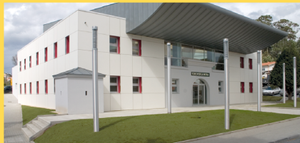
Auditorio Gabriel García Márquez Rúa do Chelito, s/n Mera / Serantes