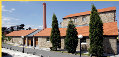
Centro Cultural A Fábrica Rúa do Inglés, 13 Perillo