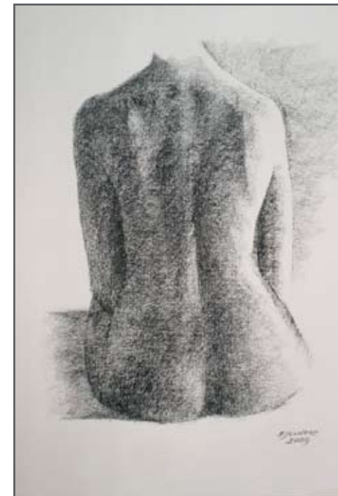
Piel 3 Barra Conté 42 x 30 cm. Año 2009