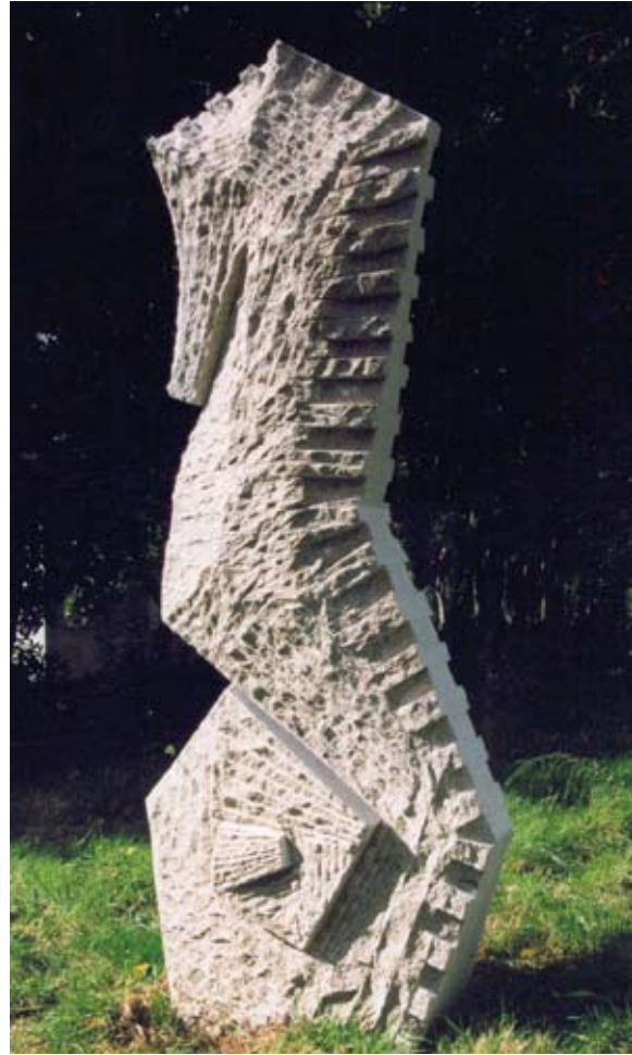
Hipocampo Granito 200 x 75 x 40 cm. Año 2002