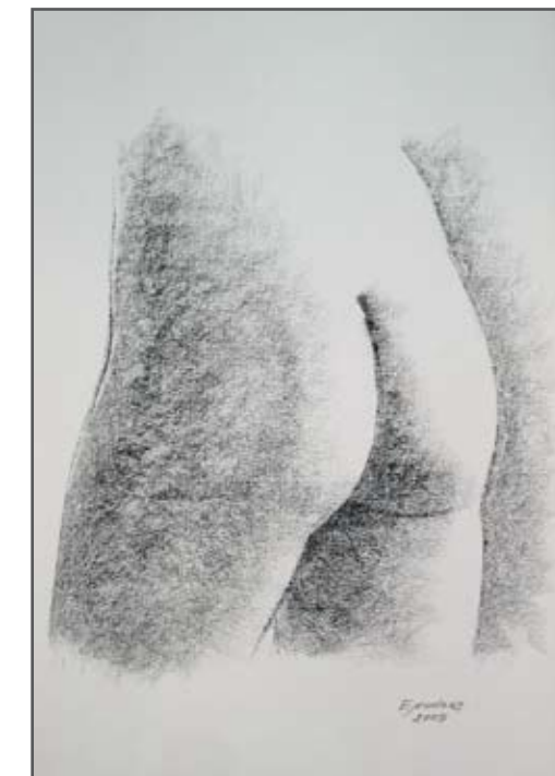
Piel 2 Barra Conté 42 x 30 cm. Año 2009