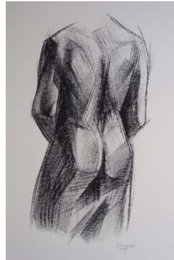
Masculino singular Barra Conté 56 x 37 cm. Año 2007