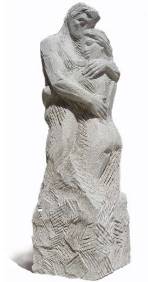
Abrazo Granito 250 x 65 x 65 cm. Año 2006