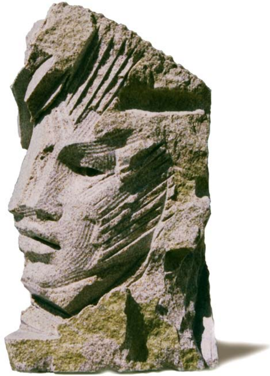
Alba Granito 50 x 30 x 35 cm. Año 2003