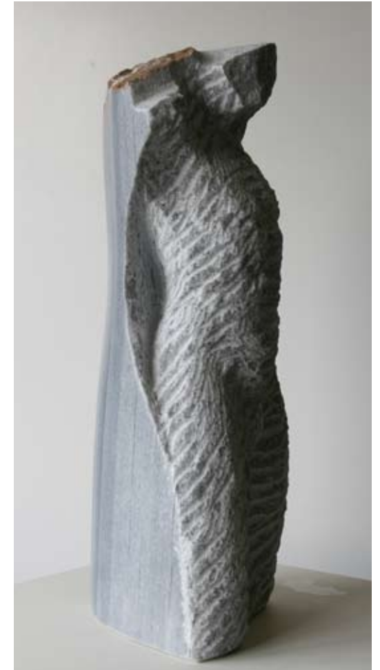
Trabe Mármol Gris Macael 54 x 25 x 18 cm. Año 2009