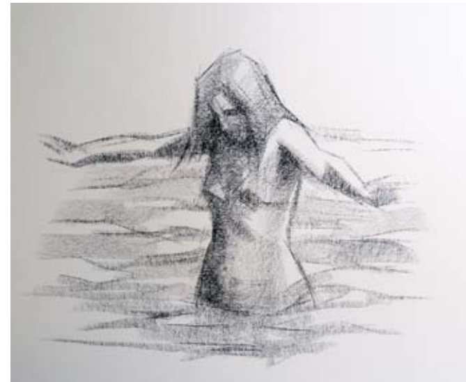
Deixándose Agarimar Barra Conté 42 x 42 cm. Año 2007