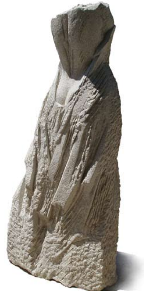
Novia Granito 230 x 110 x 80 cm. Año 2006