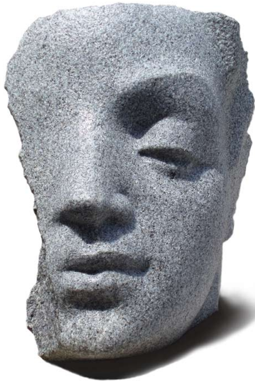
Cara Azul Granito 43 x 42 x 20 cm. Año 2009