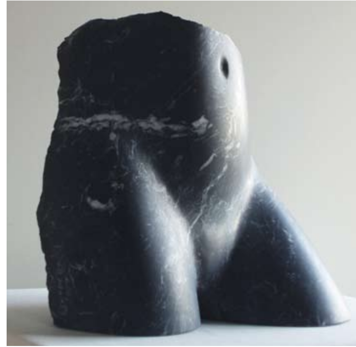
Piel Íntima Mármol Negro Markina 33 x 35 x 20 cm. Año 2009