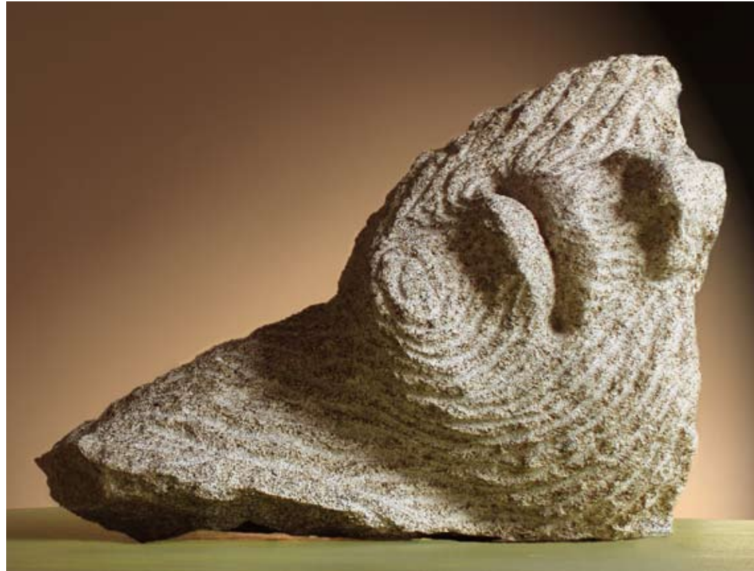
Galo Granito 45 x 31 x 25 cm. Año 2008