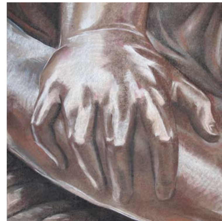
París 3 Sanguina, pastel 67 x 67 cm. Año 2009