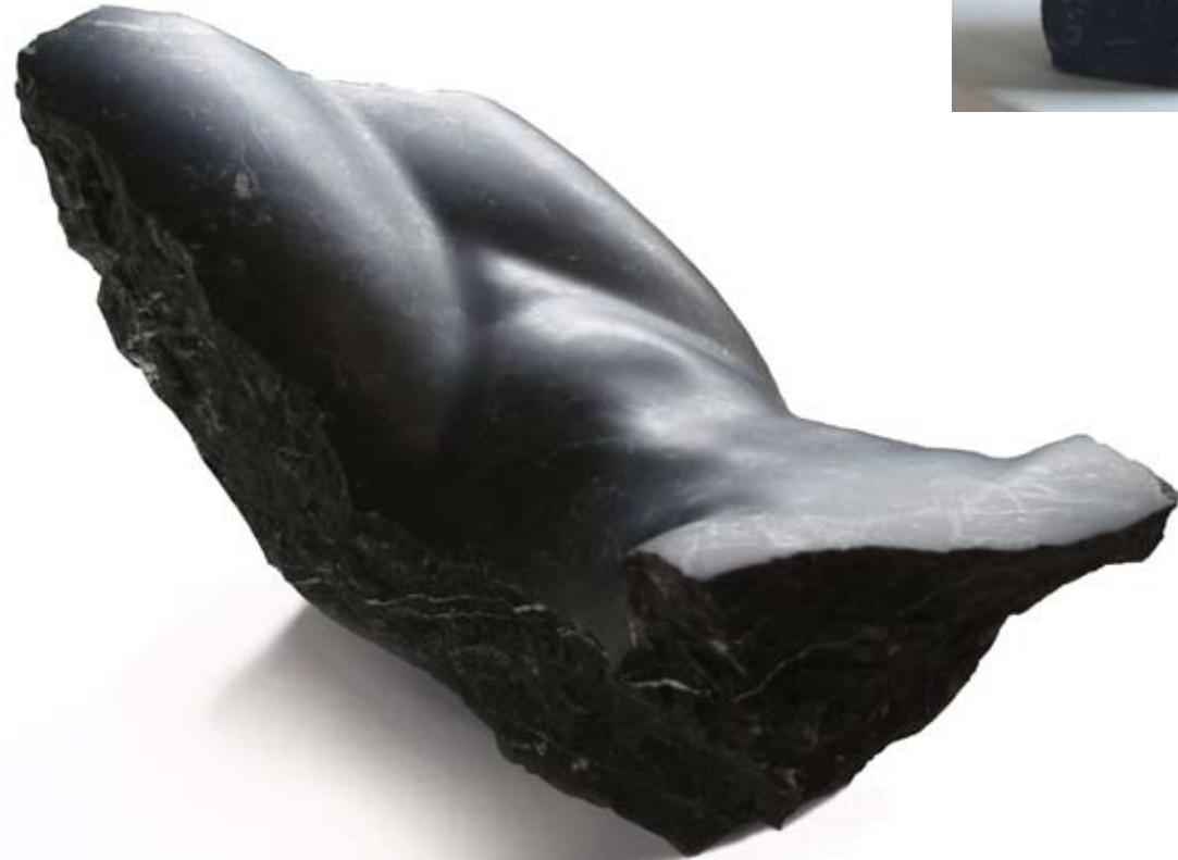
Piel 1 Mármol Negro Markina 53 x 25 x 27 cm. Año 2009