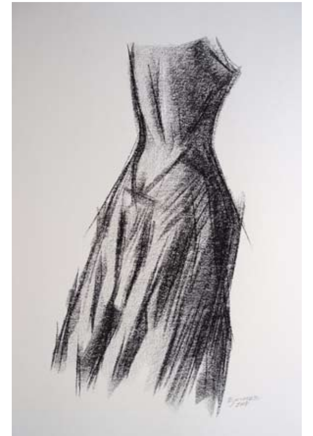
Noiva Barra Conté 52 x 37cm. Año 2007