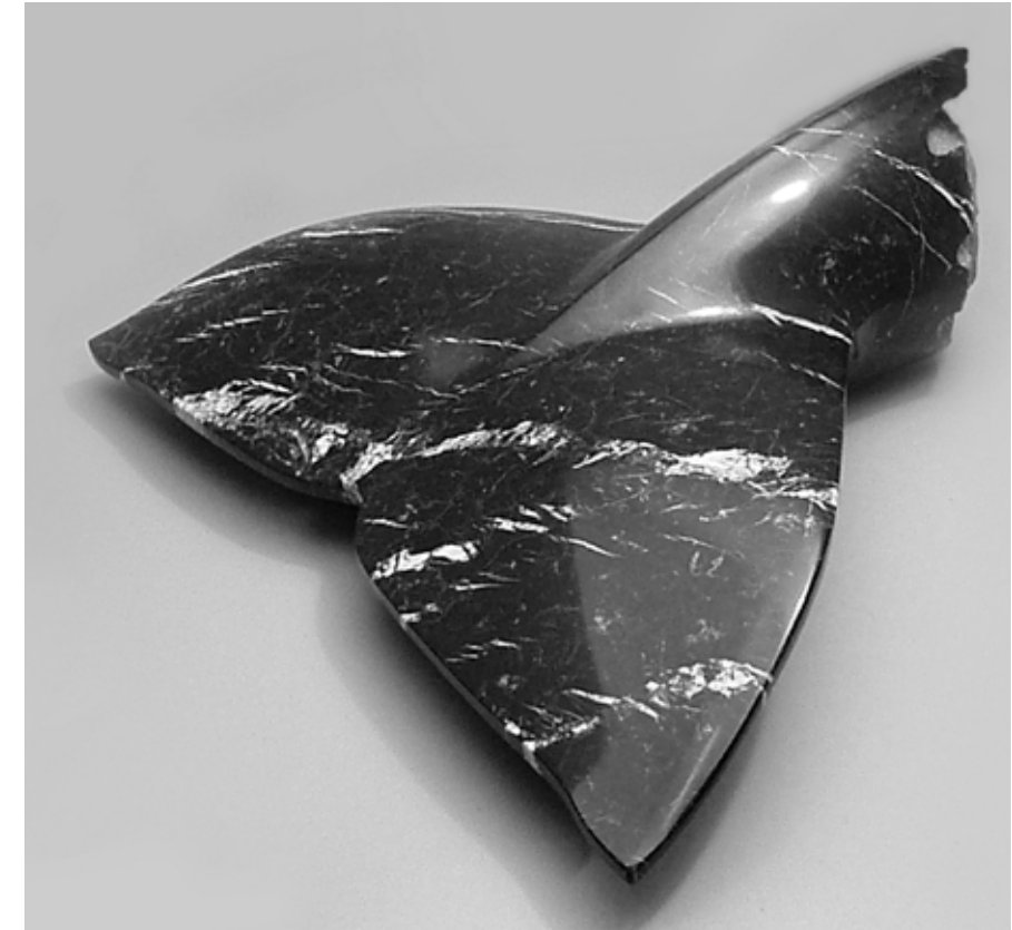
Cetáceo Mármol Negro Markina 77 x 67 x 24 cm. Año 2008