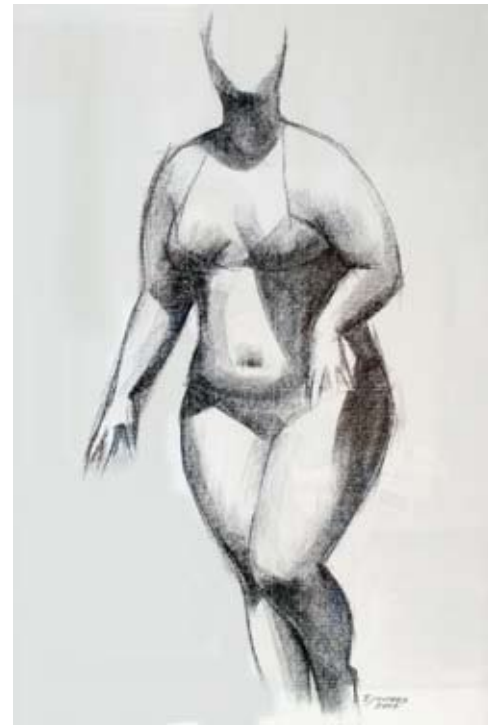
Xeitosa Barra Conté 70 x 45 cm. Año 2007