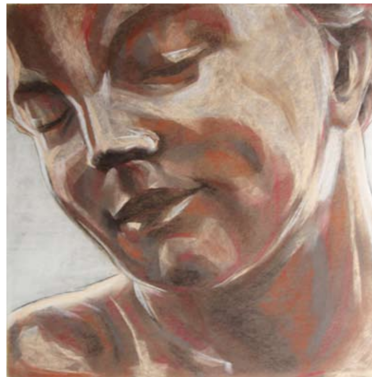
París 2 Sanguina, pastel 67 x 67 cm Año 2009