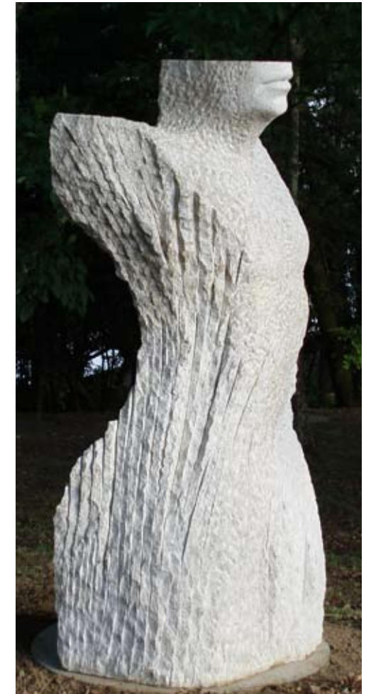
Mariñán Granito 235 x 110 x 80 cm. Año 2007 Ubicación, Pazo de Mariñán, Bergondo (A Coruña)