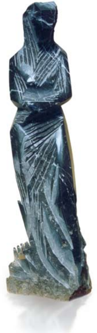
Femenina Singular Mármol Negro Markina 84 x 25 x 22 cm. Año 2004