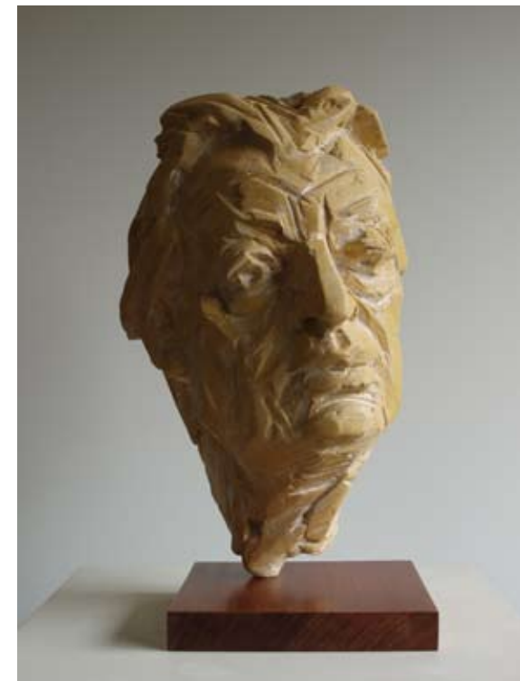
Retrato: Enrique Cortón Poliéster 45 x 25 x 35 cm. Año 2006