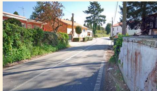
■ 1. Beirarrúas e beiravías na estrada que desde o centro urbano de Oleiros se dirixe a Soñeiro

■ No anterior número deste xornal recollíase unha extensa relación de obras pendentes por parte da Xunta de Galicia nas que se incluían ampliacións de calzadas, construcións de varias rotondas necesarias, así como a dotación por parte do Goberno autonómico de beiravías e beirarrúas en estradas da súa competencia. Destes proxectos pendentes só dous foron realizados, os pasos de peóns na área de Lóngora e na avenida Rosalía de Castro. Recordamos de novo cales son os proxectos pendentes por parte da Xunta e recolleamos as súas escusas por escrito para non desempeñalos.