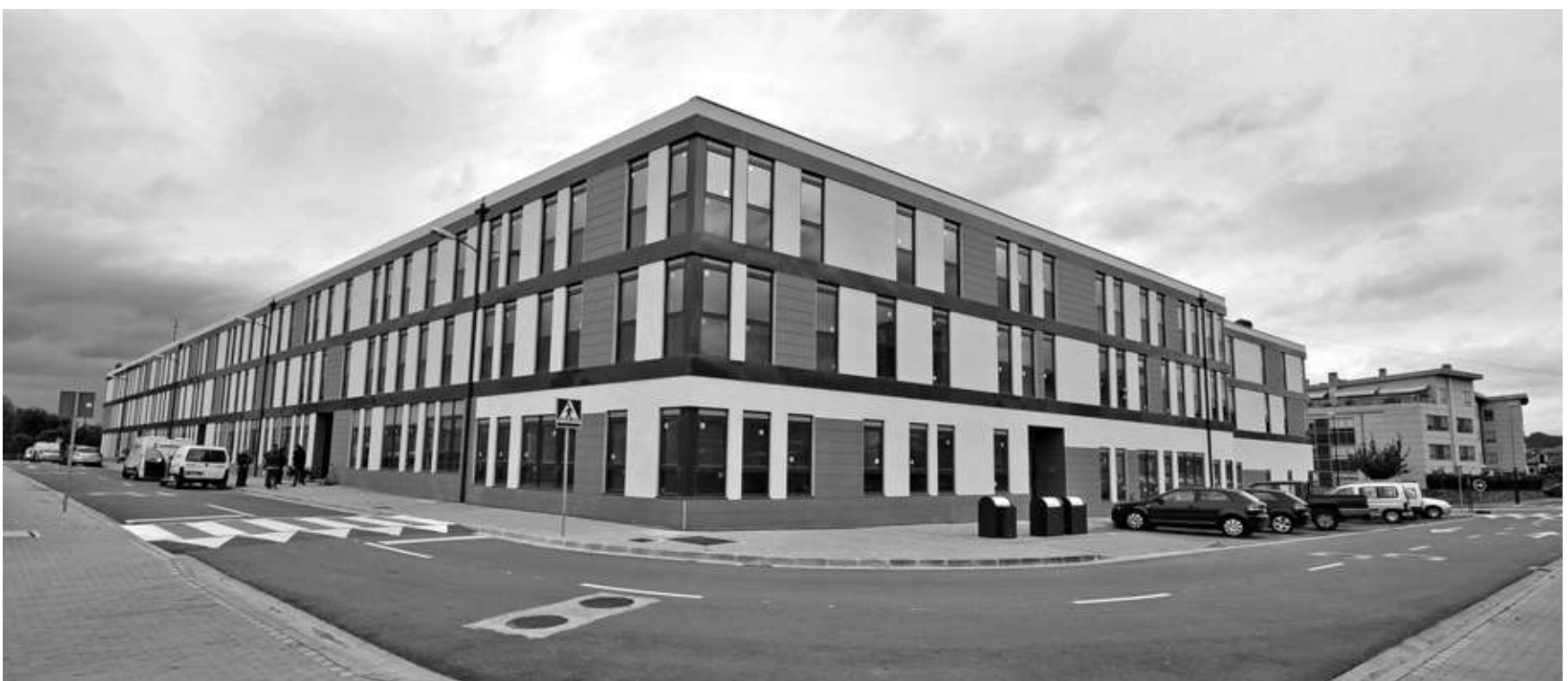
■ Vista das vivendas de promoción pública municipal edificadas en Santa Cruz, na urbanización Meixón Frío