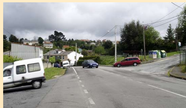
■ 3. Rondona de Vilanova