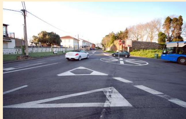
■ 6. Rondona de Arillo