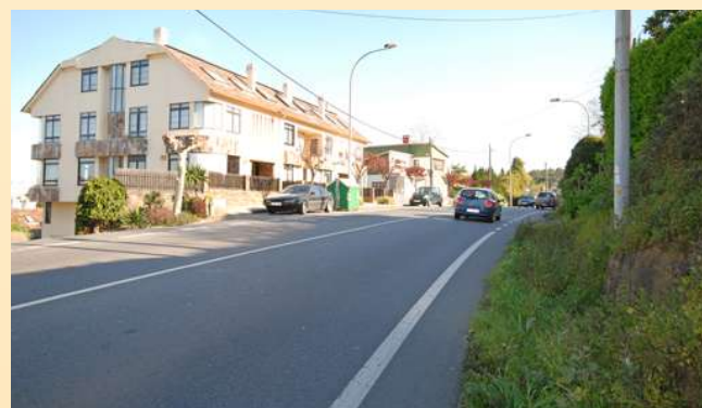
■ 7. Beirarrúas da marxe dereita na avenida Che Guevara desde o restaurante Orlinda ata a rotonda de Nirvana