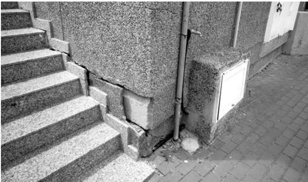
▲ O dano estrutural que sofre a escaleira que dá acceso á casa do mar de Mera representa un perigo para as persoas usuarias

O Concello seguirá a denunciar o mísero estado que presenta esta instalación que depende da Xunta de Galicia e que debería estar a prestar un correcto servizo aos veciños e ás veciñas da zona. Como vén formulando desde hai tempo o Goberno local, a reforma do edificio pasaría por unha mellora da planta alta do edificio, para que funcionase de forma digna como centro social para maiores e unha ampliación das instalacións sanitarias utilizando o espazo que agora se encontra sen uso da planta baixa, para así dotar a zona norte dun centro de saúde de calidade que dispoña de novos servizos e que mellore a atención primaria e a equipare á doutras zonas do municipio.