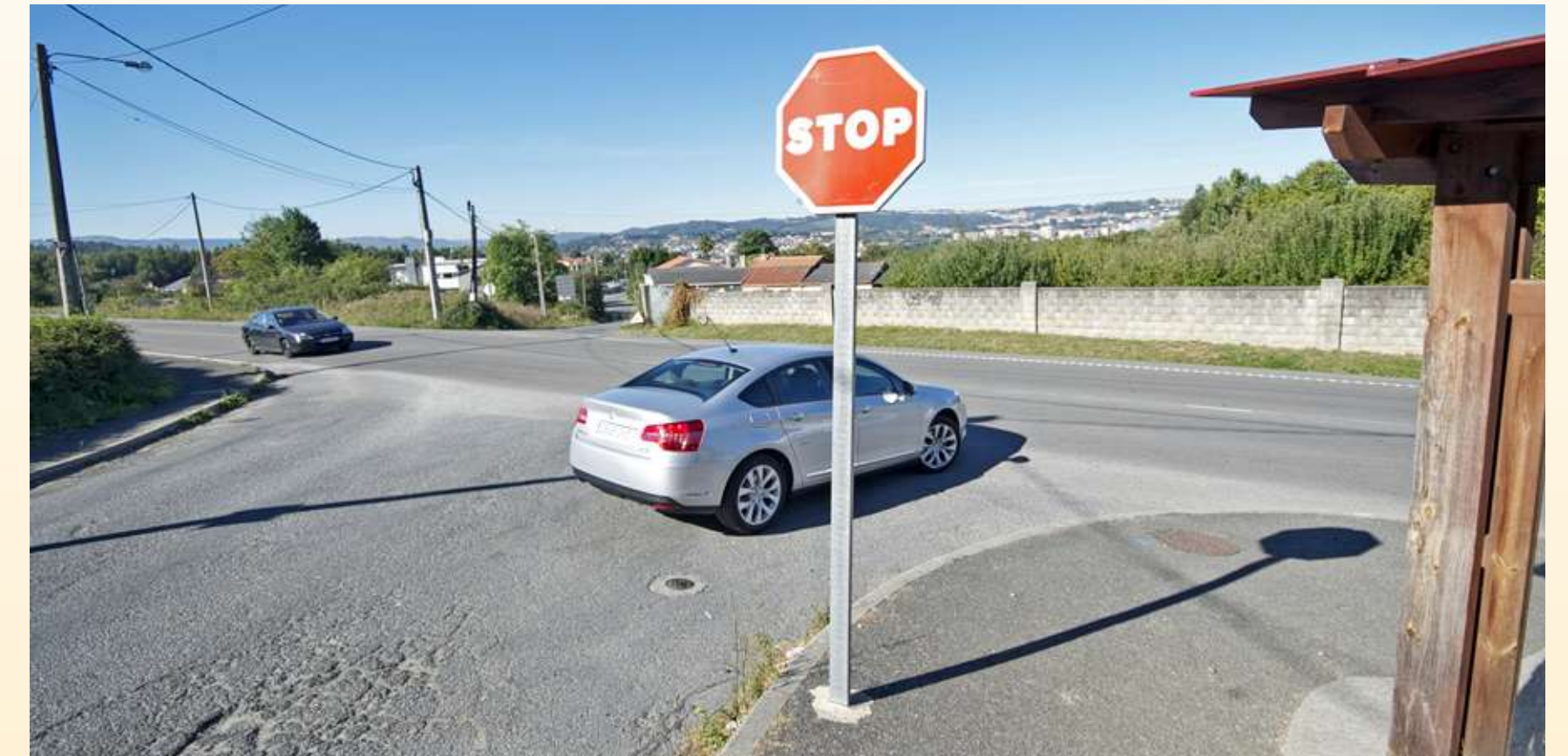
■ A perigosidade da intersección de Vilanova solucionaríase coa construción dunha rotonda