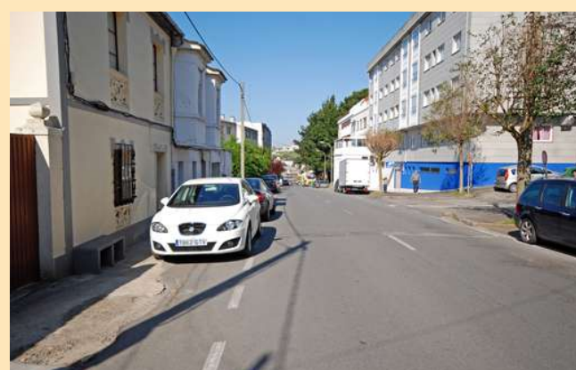
■ 8. Tramo de beirarrúas na marxe dereita baixando desde Lucín ata a ponte Pasaxe

◆ O Goberno local instou a Xunta a través do pleno da corporación o pasado 13 de maio a que realizase algunha das obras mencionadas, xa que o Concello considera que son prioritarias, urxentes e vitais para mellorar a seguridade viaria. O pasado 23 de agosto a Consellería de Medio Ambiente, Territorio e Infraestruturas contestou ao Concello de Oleiros sobre as súas peticións.