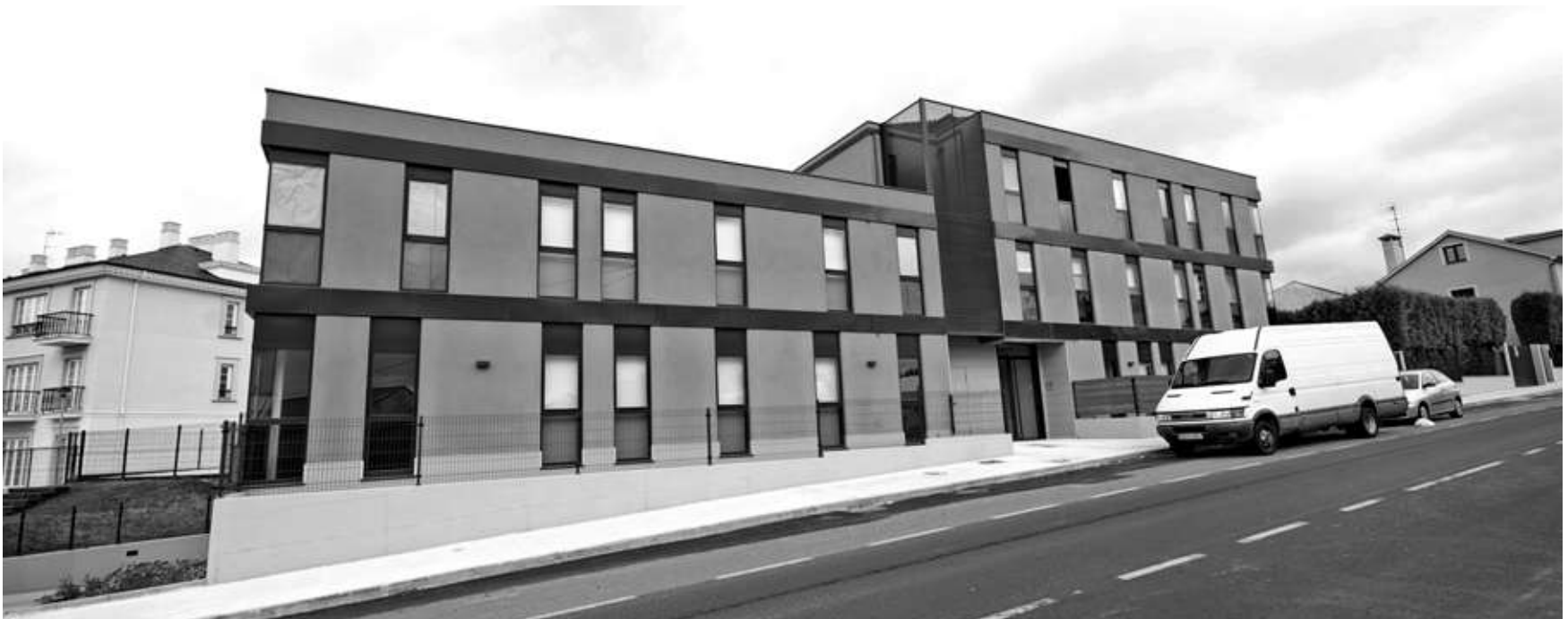
■ Vista das últimas vivendas de promoción pública construídas na urbanización da Pezoca, en Santa María de Oleiros

nos últimos 6 anos promoveu o Concello de Oleiros en solo público municipal. Ademais, proximamente poñerase en marcha a edificación de 35 novas vivendas de protección, 27 na parroquia de Liáns, na localidade de Santa Cruz, fronte ao hotel Portocobo e 8 nas inmediacións da Casa do Concello. As cooperativas destas dúas promocións xa foron constituídas e se prevé a adxudicación do solo antes de final de ano.