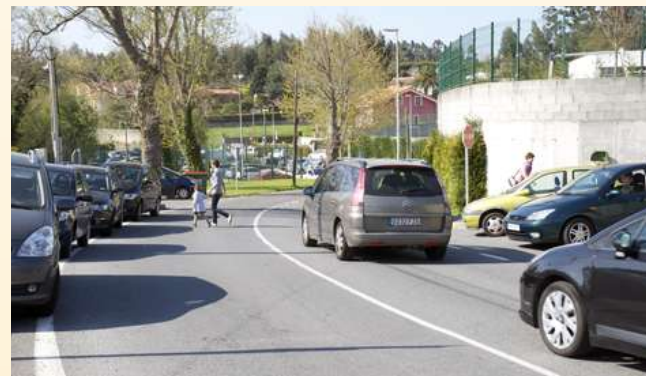
■ 5. Beirarrúas desde a rotonda das Pedreiras ata o colexio Cristo Rey