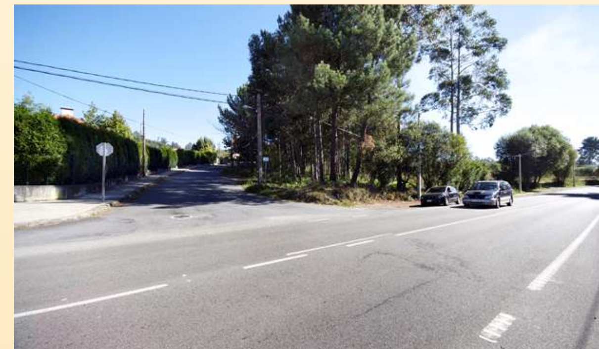
■ O cruzamento das Grobias presenta serias carencias de seguridade viaria

◆ Respecto ás dúas rotondas que se demandaban por parte do Concello, unha na avenida Salvador Allende, no lugar da Chasqueira, no cruce de Pravio e Liáns, e outra en Vilanova, no cruce entre Manuel Murguía, Pilar Estevez Diéguez e Salvador Allende, a Xunta contestou no primeiro caso que se trata dunha competencia da Deputación Provincial e no segundo sinala que «non é unha obra prioritaria». Sobre as beirarrúas das Grobias, na mesma rúa Salvador Allende, a Xunta apunta na súa carta que a seguridade viaria é unha máxima nos obxectivos da Dirección Xeral de Infraestruturas, pero sempre dentro das posibilidades orzamentarias. É dicir, a Xunta contesta cun si pero non.