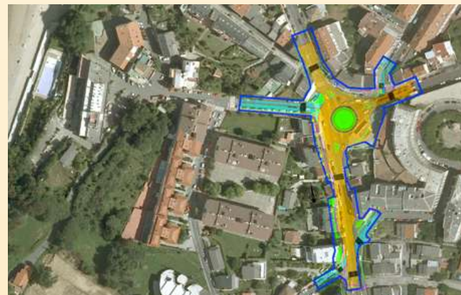
■ 2. Rondona de Santa Cruz