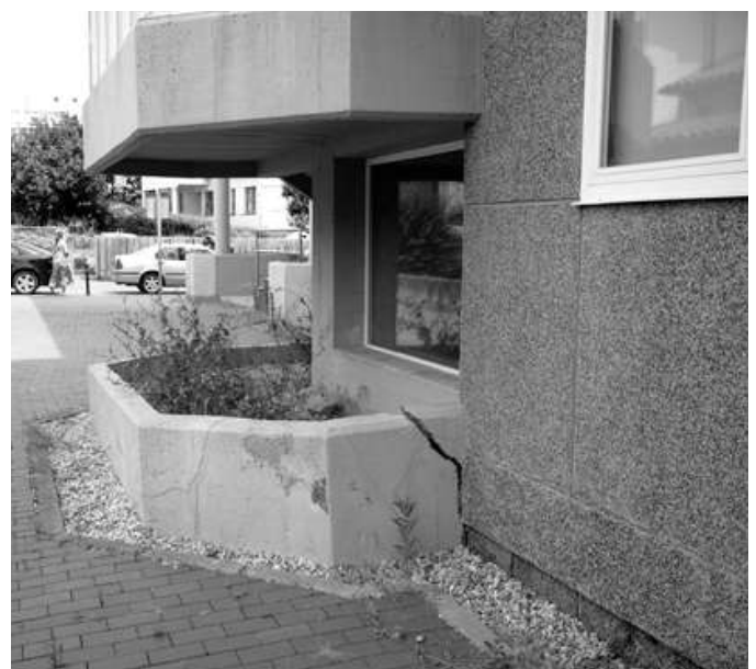
▲ A deterioración na fachada do edificio é palpable a través das numerosas gretas que en ocasións, como se amosa nesta fotografía, presentan varios centímetros de grosor