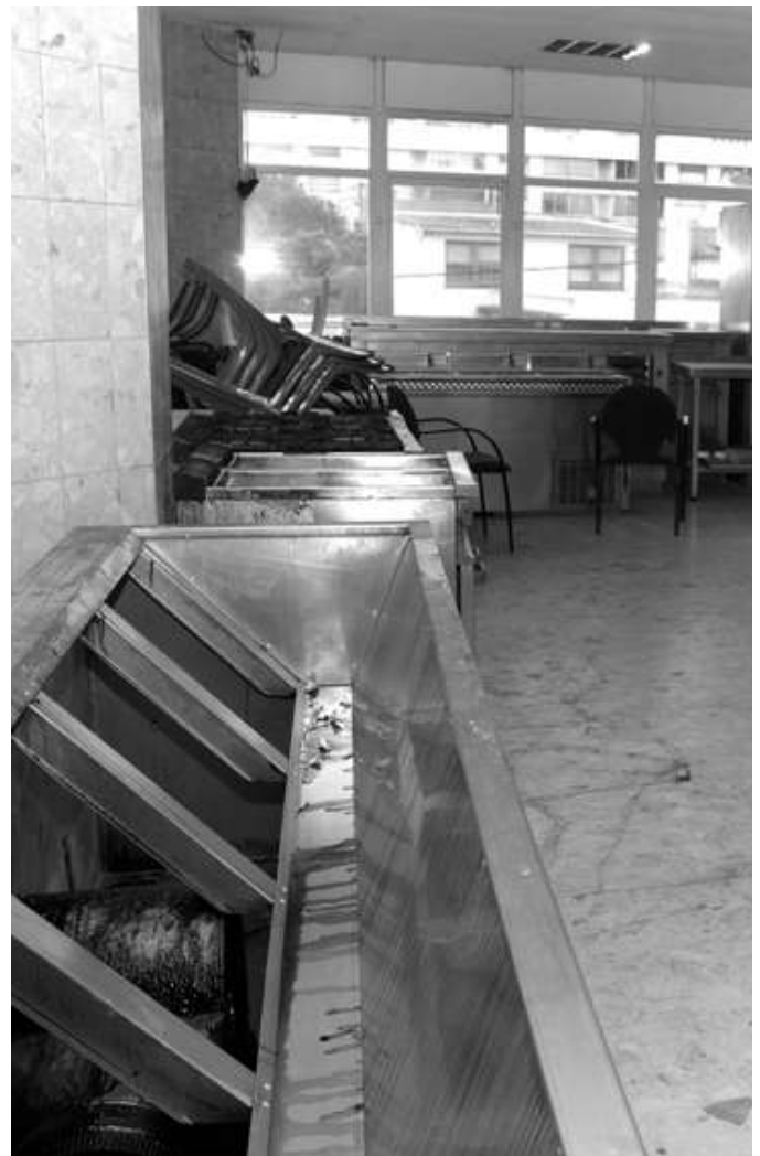
▲ Aspecto de total abandono que presentan as salas interiores da instalación de Mera