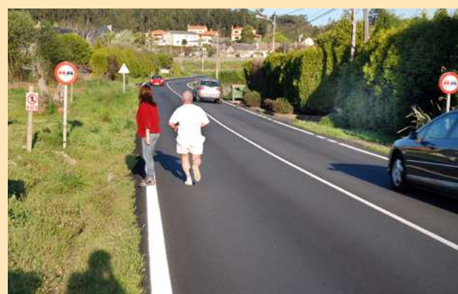
■ 4. Beirarrúas na estrada que desde Arillo se dirixe a Mera entre Lourido Grande e a intersección de Breixo