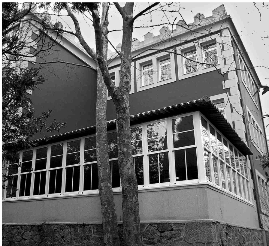
■ Vista exterior da ampliación da biblioteca de Santa Cruz.