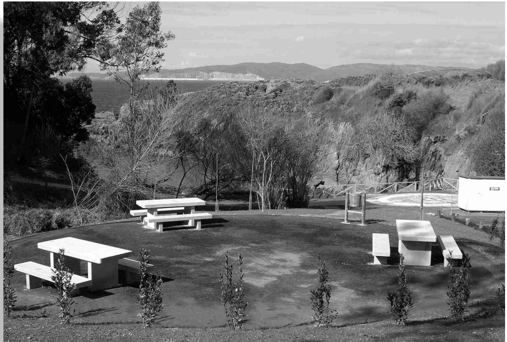
■ A recuperación deste espazo permite dotalo de novos servizos.

◆ Cunha aportación económica do Proder e cunha financiación de 112.000 €, rematouse a execución dunha nova área recreativa no ámbito natural do Porto de Dexo. Os traballos consistiron na recuperación dun espazo de interés ambiental de máis de 2.000 m 2 coa rehabilitación dos accesos peatonais ó mar, o acondicionamento dun merendeiro, a rehabilitación de sendeiros, e a recuperación, desbroce e limpeza dos cauces. Deste xeito facilitarase o acceso ós veciños e turistas que frecuentan a zona a diario. E, dende agora, ademais, cun novo elemento: unha representación da rosa dos ventos con figuras de golfinhos para recreación dos máis cativos.