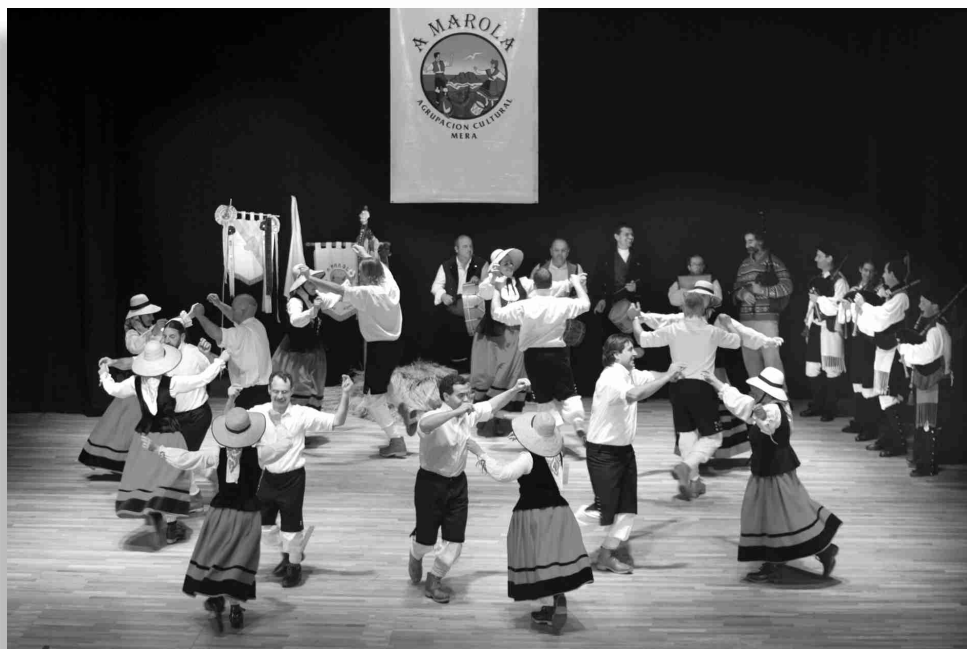
■ Actuación do grupo de baile de veteranos o pasado 24 de febreiro polo 25 aniversario.

Por iso, e por moito máis, vaia para os de antes e os de agora, o aplauso máis sincero.