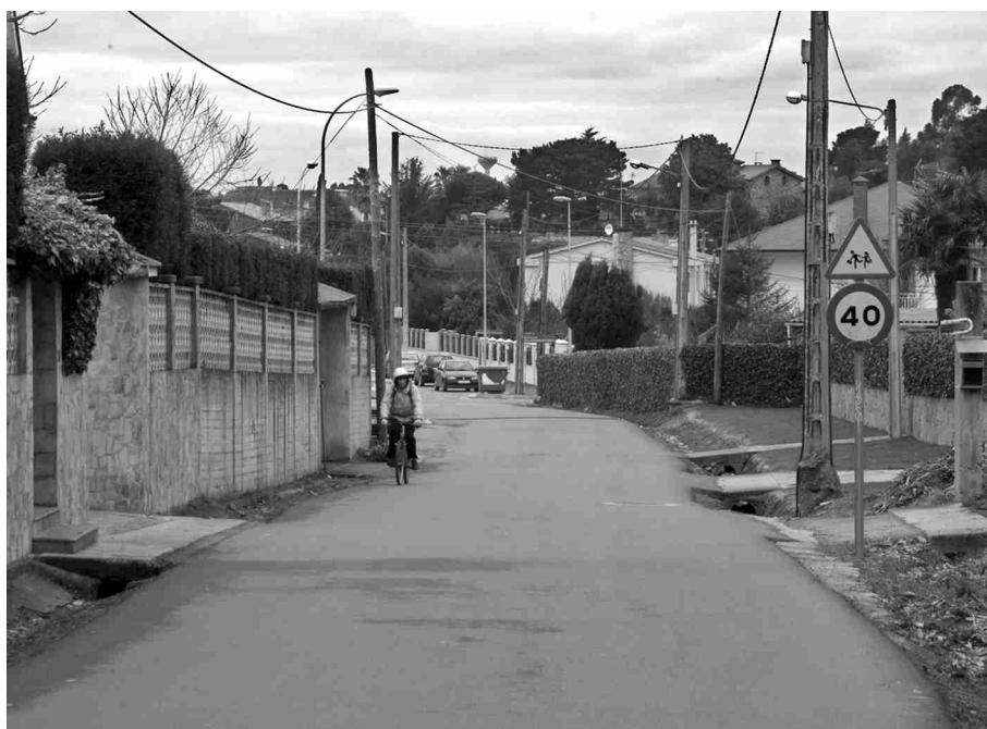
■ Tramo paralizado en Valle Inclán pola falla de colaboración veciñal.