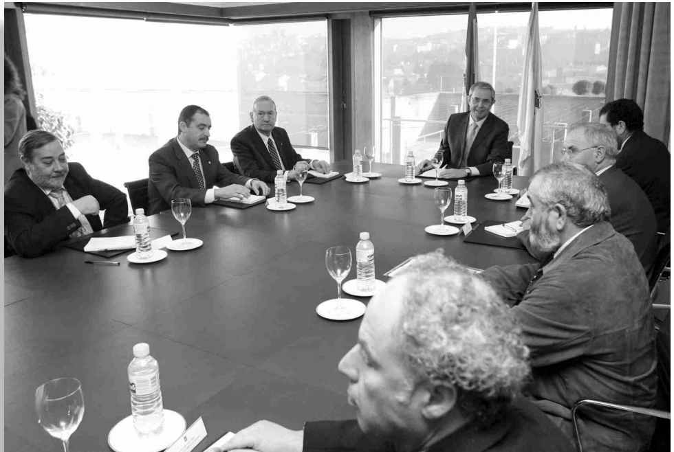
■ Os rexedores do Consorcio das Mariñas conversaron co Presidente da Xunta sobre a área metropolitana