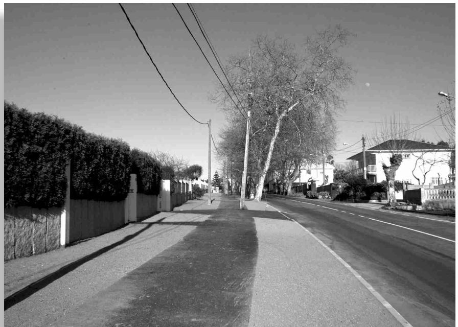
■ Avenida Miguel Hernández na actualidade.