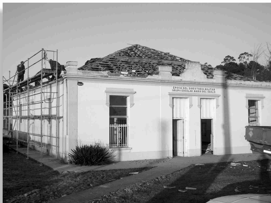
■ Fachada en obras da Escola das Pedras.

Instalación dun ascensor para acadar un maior aproveitamento das plantas altas coa conseguinte eliminación de barreiras arquitectónicas.