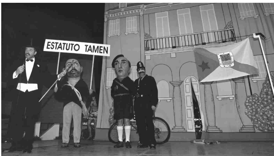
■ Un momento da parodia de carnaval celebrada o pasado día 3 de marzo.