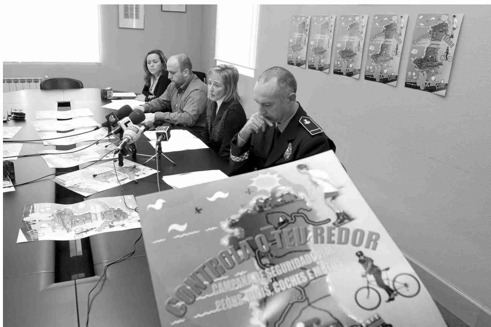
■ No centro os concelleiros de Ensino e Réxime Interior durante a presentación da campaña.

■ NA AULA: Lévanse a cabo actividades didácticas para concienciar a nenos e adultos da necesidade de cambiar as condutas e os comportamentos de risco para unha circulación máis segura. A colaboración do departamento de Policía é imprescindible para a posta en marcha de: