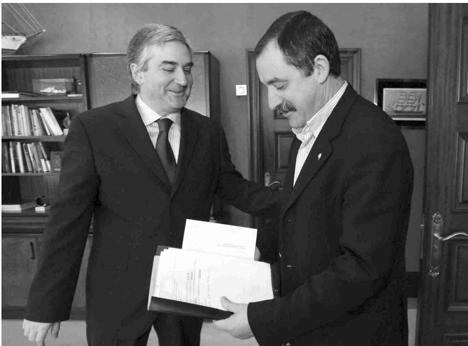
■ O Alcalde de Oleiros ó inicio da súa entrevista co Conselleiro de Industria

■ 23 de xaneiro: Entrevista do Consorcio das Mariñas co Presidente da Xunta de Galicia en Santiago de Compostela. Demandouse un maior desenvolvemento e expansión da Área Metropolitana . Mais inversión, novas infraestruturas e maior autonomía. Acadouse un compromiso firme para a contratación, este ano, da Vía Ártabra .