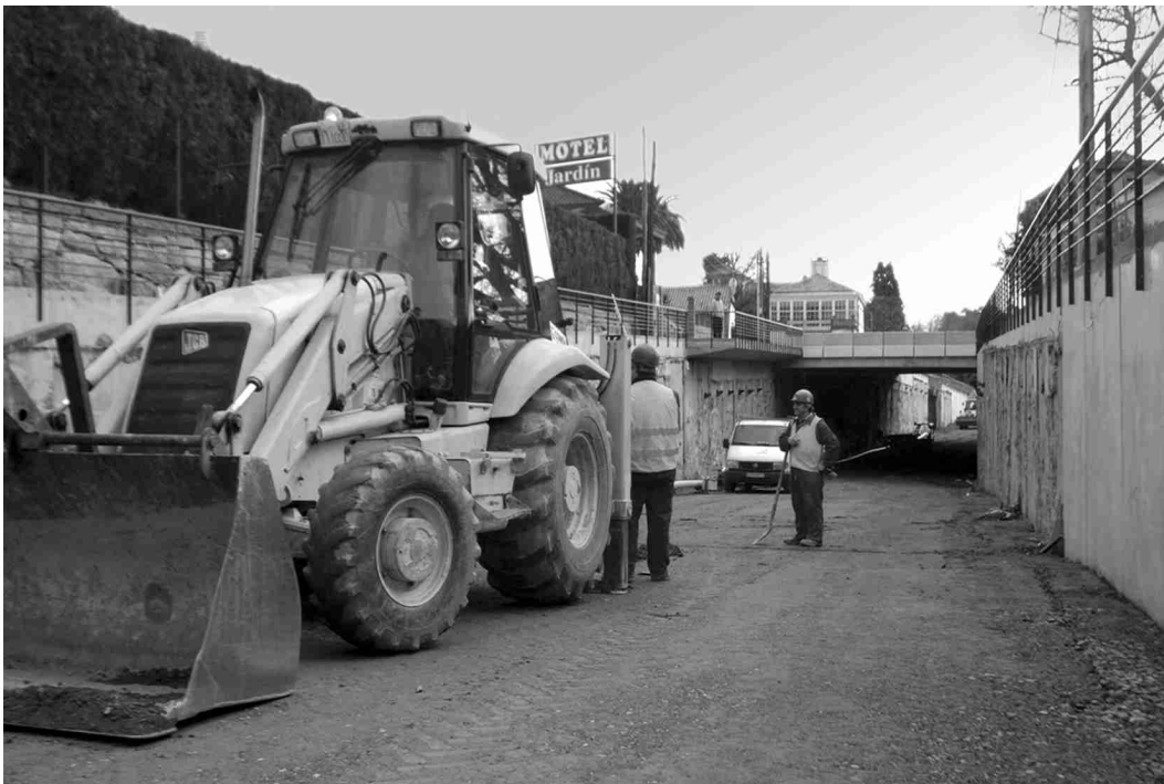
■ Ultimando os traballos de acondicionamento antes da súa apertura.