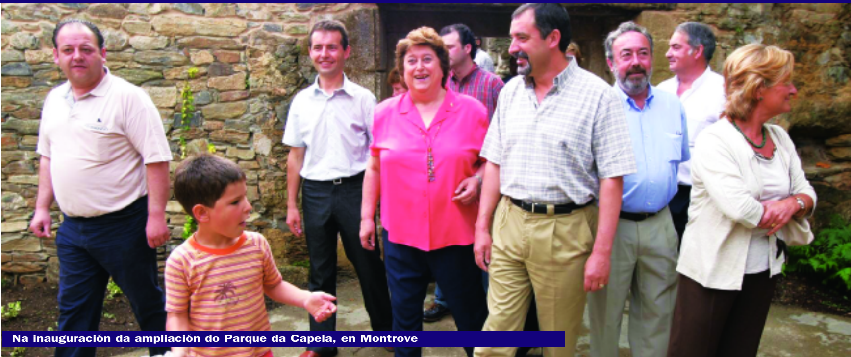
Na inauguración da ampliación do Parque da Capela, en Montrove