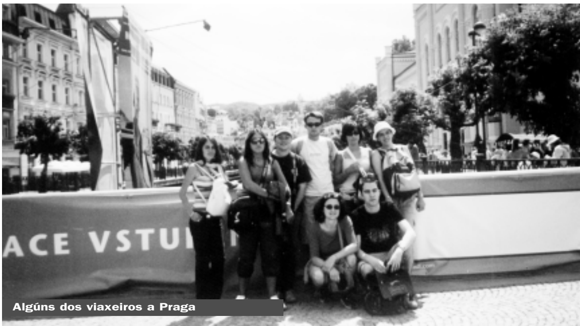
Algúns dos viaxeiros a Praga

Os cincuenta mozos e mozas que por sorteo ganaron en Ocioleiros unha viaxe a Praga xa están de regreso. Na capital checa deixaron moitas lembranzas inesquecibles.