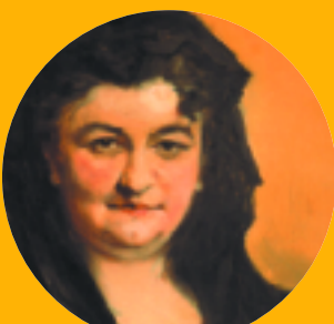
Francis Drake, Felipe II e Dona Emilia Pardo Bazán