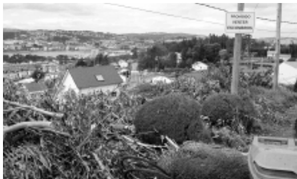
Loitar contra os vertedoiros incontrolados, obriga de todos.

Moitos cidadáns non coñecen aínda o Punto Limpo, situado na rúa que une Oleiros con Iñás, Fonte do Ouro. Témolos obriga de deixar alí os refugallos que non poden depositarse nos contedores convencionais.