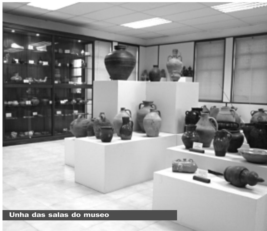
Unha das salas do museo

A interesante colección de cerámica que acocha o Museo dos Oleiros “José María Kaydeda” é única en España. Por eso quérese fomenta-lo seu coñecemento e impulsar o seu carácter de atractivo turístico.