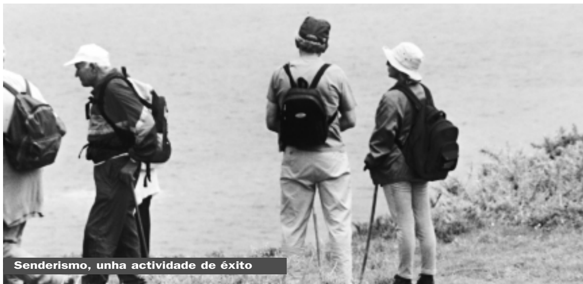
Senderismo, unha actividade de éxito

Como cada ano, en setembro reiniciaránse os creativos obradoiros ós que tantas persoas maiores acoden. Teña a punto a súa memoria e lembre que pode realizar unha preinscripción cando o desexe.