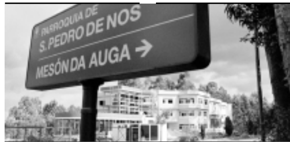
O edificio cando aínda estaba en obras