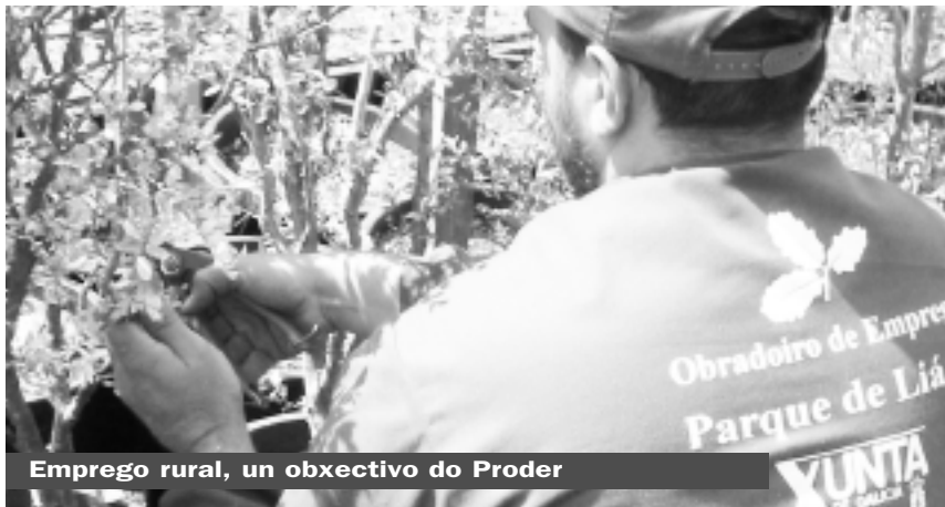
Emprego rural, un obxectivo do Proder

Fóron moitos os emprendedores que se achegaron ós Regos para solicitar información con vistas a crear unha empresa.