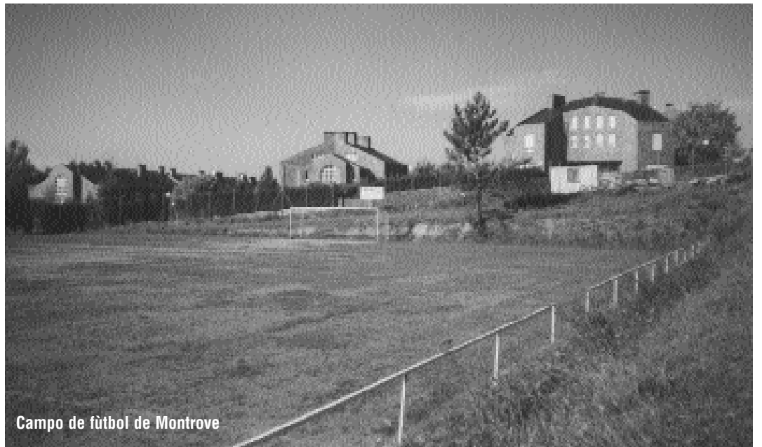
Campo de fútbol de Montrove

Campo de Montrove O valor das obras de mellora no campo de Montrove (donde xoga o Unión Campestre) chega aos 22 millóns de pesetas, dos que 18 corresponden ós novos vestiarios e ambigú, e os outros catro restantes ás novas gradas. Precisamente, o citado clube disporá