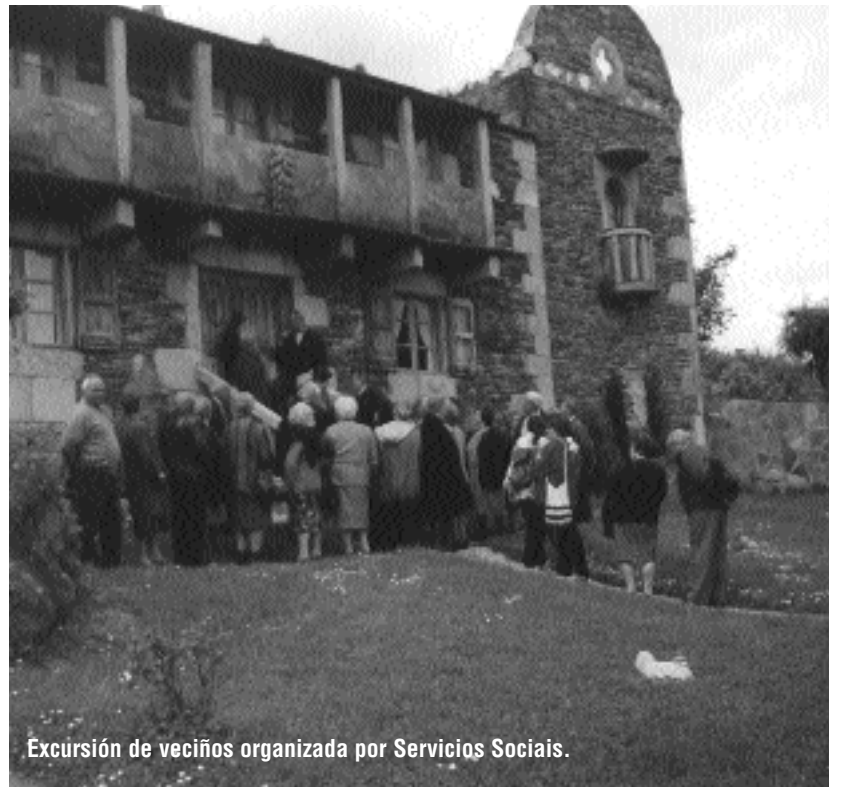
Excursión de veciños organizada por Servizos Sociais.

so en pacientes mentais xerátricos. Ademais, está a posibilidade de desenvolver novas vías de comunicación, xunto a estimulación da necesidade de