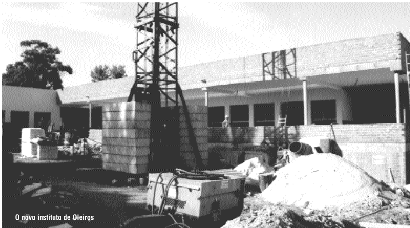
O novo instituto de Oleiros