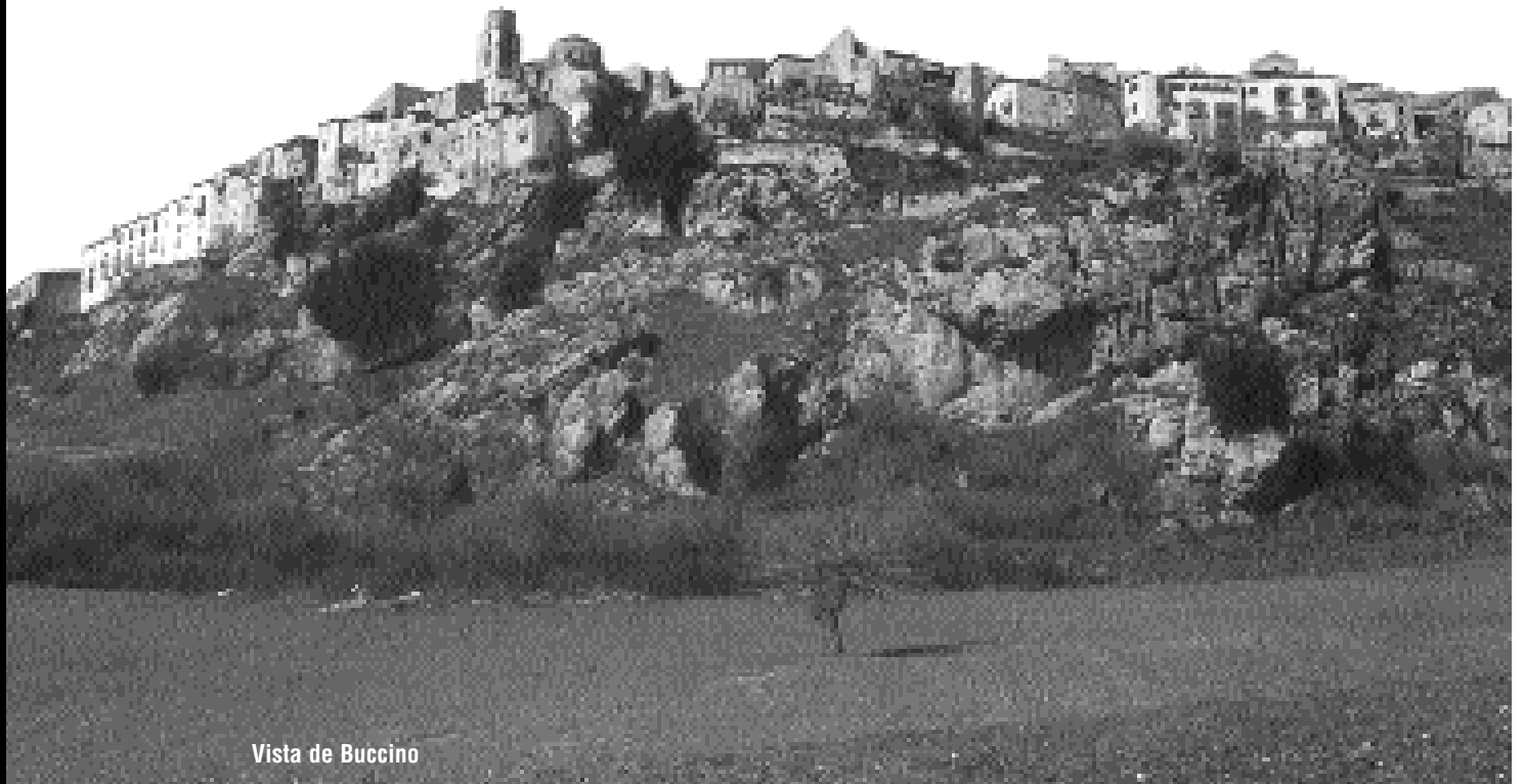
Vista de Buccino

Viaxe ó Parque Natural Villafafila . Ponte de decembro