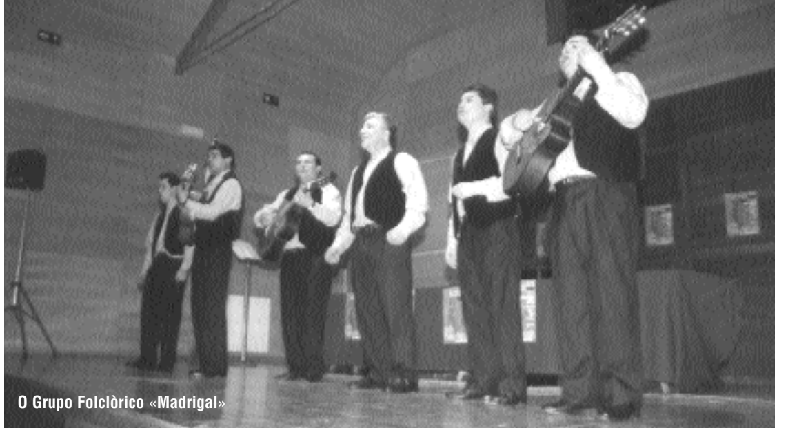
O Grupo Folclórico «Madrigal»

No acto quedou patente que por encima das fronteiras a arte é capaz de agasallar coa emoción calquera expresión solidaria e universal.