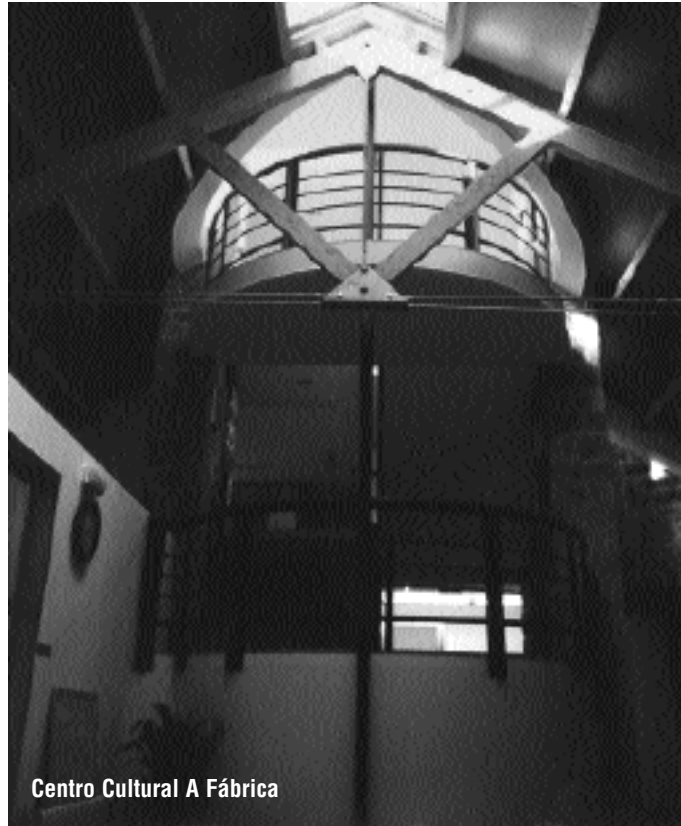
Centro Cultural A Fábrica

Organizativamente, o plantexamento é moi amplo, pero ira-se moldeando segundo se reciban as demandas de formación das persoas interesadas, que deben realizar a preinscripción dentro do mes de novembro. Unha vez que se teñan eses datos, automaticamente veremos qué cursos se poñen en funcio-