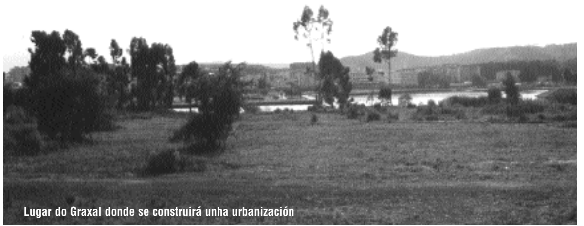
Lugar do Graxal donde se construírá unha urbanización

Informan nas casetas de obra ou no Concello: 981 610 000