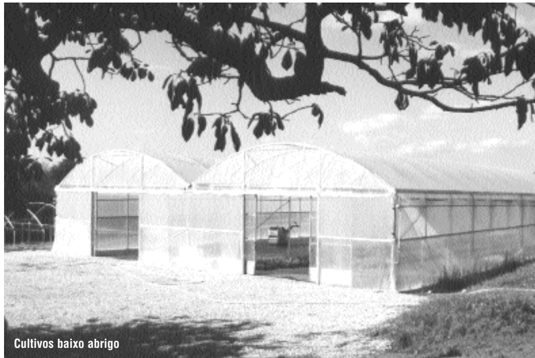
Cultivos baixo abrigo