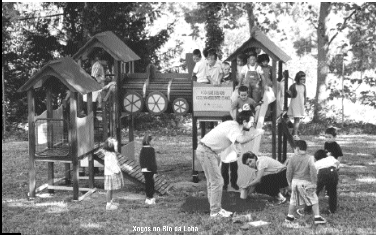
Xogos no Río da Loba