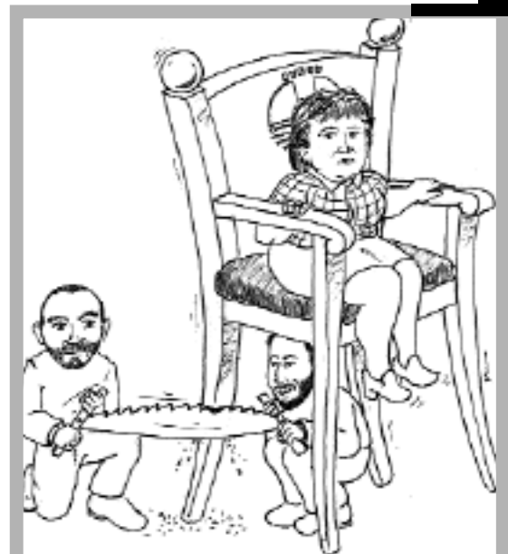
Concelleiros «progres» apuntalando o goberno municipal

Ogallá os prexuízos políticos o fagan posible. Ganaríamos todos.