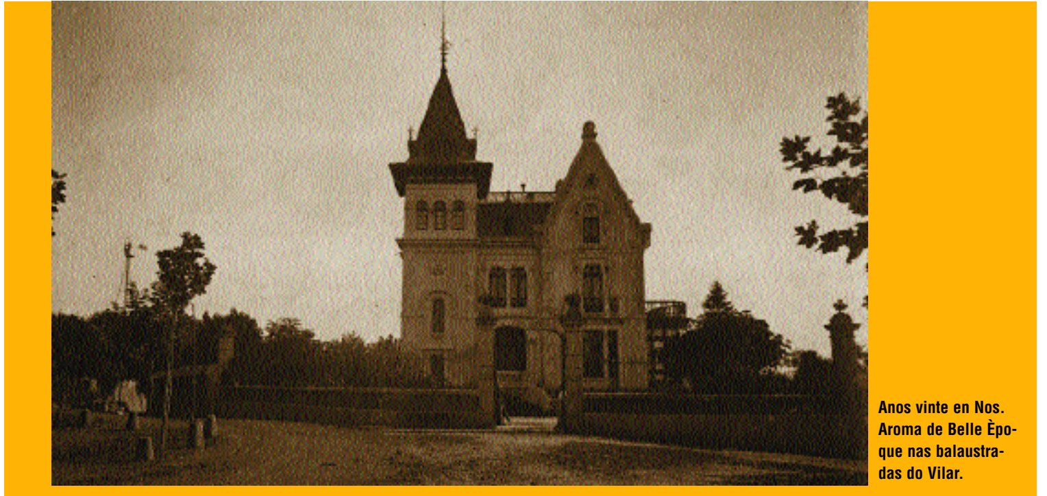
Anos vinte en Nos. Aroma de Belle Époque nas balaustadas do Vilar.

Revitalízase un engaiolante edificio de principios de século «escondido» no cumio de Nos