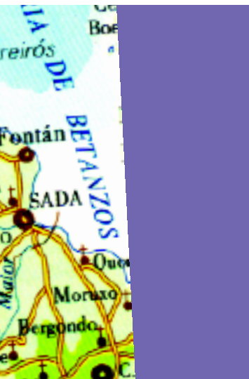
Mapa da Área Metropolitana

ixo, os bombeiros ou os autobuses. Con ese obxectivo, en 15 anos, a Mancomunidade de Concellos, que por aí funciona.