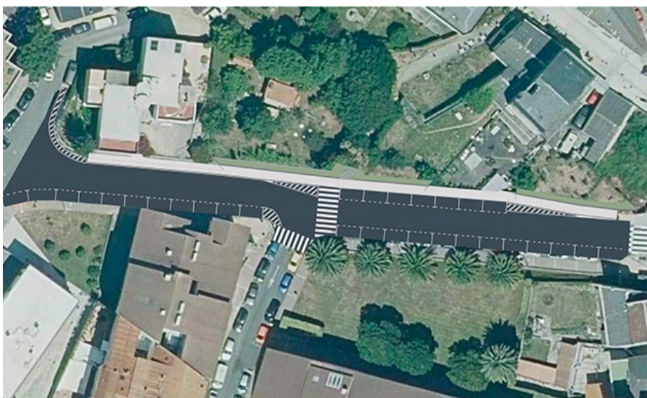
■ Rúa Ricardo Cubeiro

◆ O Goberno municipal sacará a licitación as obras de construción de beirarrúas no centro de Santa Cruz, nas rúas Ricardo Cubeiro e Daniel Castelao. Desta maneira preténdese consolidar a malla urbana desta localidade, dotándoa de maior seguridade para peóns e condutores.