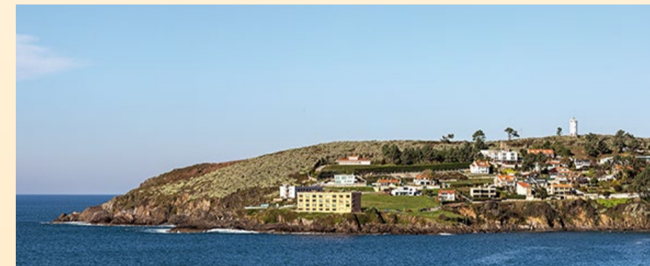
■ Aspecto actual da zona do faro de Mera

◆ Outra das propostas realizadas por parte do Concello á Xunta, é a de actuar no Monumento Natural da Costa de Dexo-Serantes ante o avance incontrolable do Helichrysum petiolare , moi visible a simple vista nas zonas dos faros de Mera e da punta Torrella. O forte impacto e degradación que supón esta especie invasora neste espazo protexido require dunha actuación medioambiental que garanta a biodiversidade e o ecosistema. Ata o momento a Consellería de Medio Ambiente tampouco respondeu a esta petición.