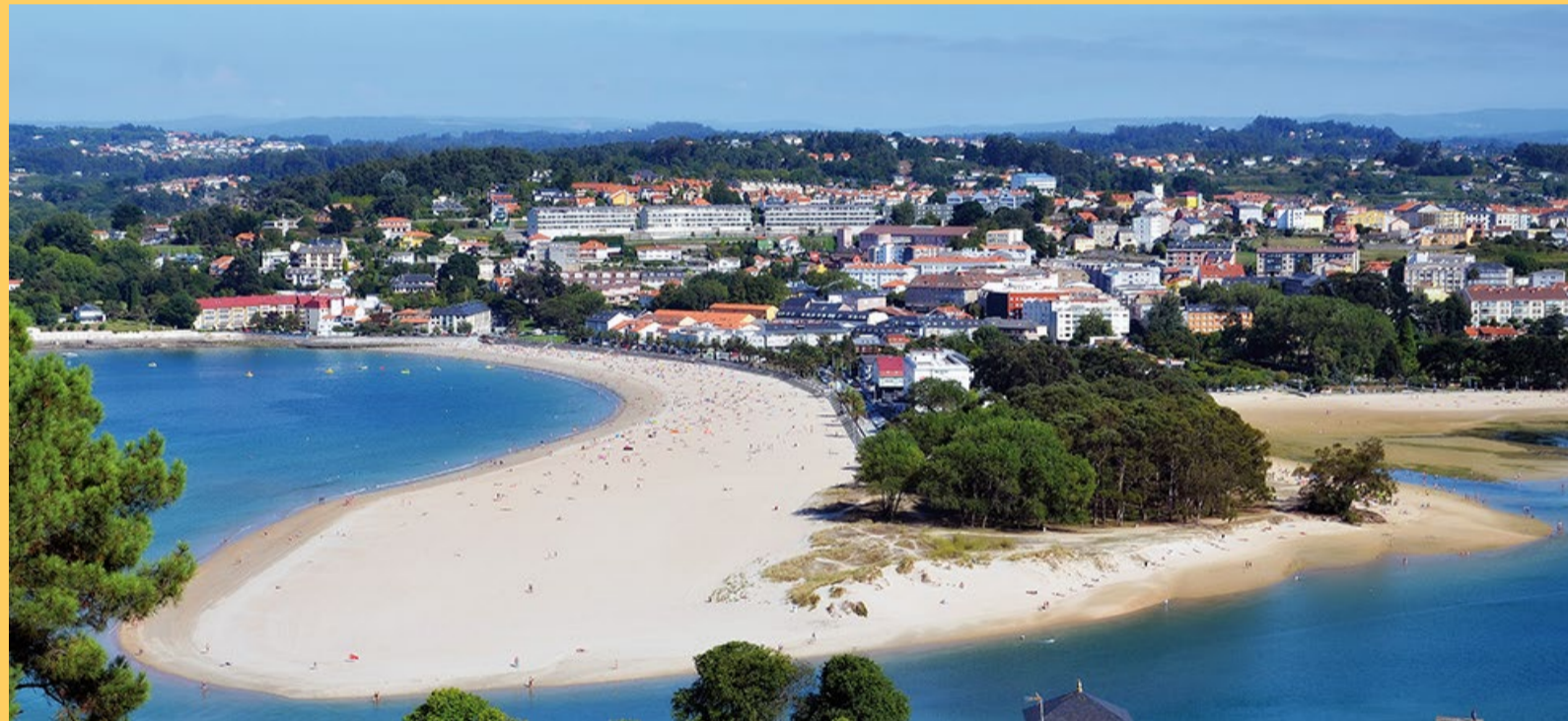
■ A Xunta pretende invadir as dunas cunha pasarela

Un deses anuncios propagandísticos foi o de creación dunha pasarela entre Oza e Santa Cristina por 8 millóns de euros. Unha obra para a que non existe consenso cos concellos, cuestión imprescindible posto que as vías teñen que estar recollidas dentro dos plans xerais de urbanismo. De querer realizar esta pasarela, sería necesario desenvolver plans especiais de ordenación dos ámbitos afectados, comprar ou expropiar o solo necesario e tramitar os informes de impacto ambiental. É dicir, indo todo ben, habería un mínimo de 3 anos de trámites.