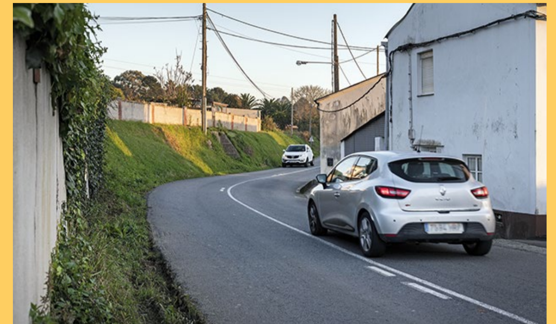
■ A avenida Isaac Díaz Pardo é unha das estradas da Xunta en Oleiros que presenta un maior perigo para os peóns