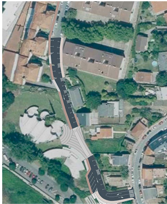
■ Rúa Daniel Castelao