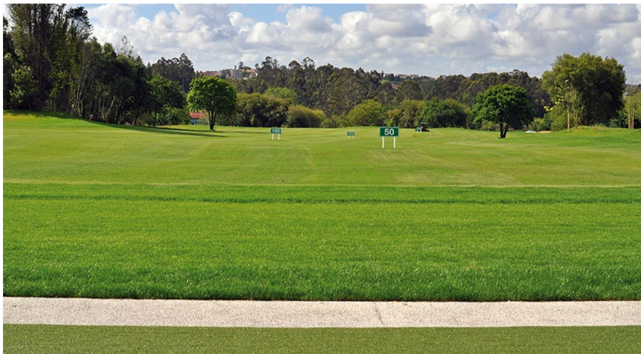
■ Campo de prácticas rematado para a Escola Municipal

◆ O Concello está elaborando o convenio de colaboración coa empresa que xestiona o campo de golf de Xaz para o uso por parte do Concello dunha parte das instalacións, en concreto o campo de prácticas. A intención é crear unha escola de iniciación que permita poñer en coñecemento esta actividade deportiva.