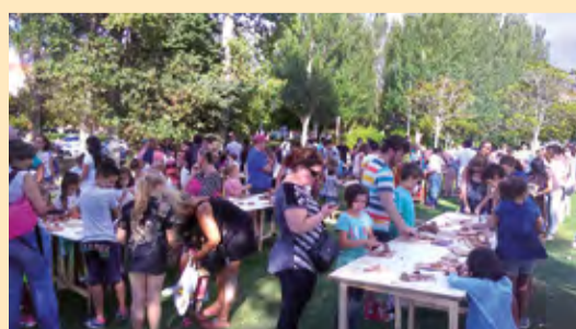
■ As asociacións de veciños tamén acceden a fondos municipais para custear a súa programación cultural, festiva e de ocio.