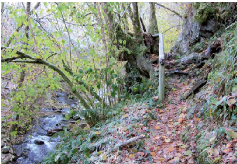
A FONSAGRADA: 12 DE MAIO

◆ O programa municipal Andares por Galicia: a cultura da natureza ten programadas tres excursións para os vindeiros meses. Dirixidas a un público familiar, tamén poderán participar menores de idade acompañados por adultos. Todas aquelas persoas interesadas en apuntarse poderán informarse e inscribirse persoalmente no Departamento de Cultura (A Fábrica), no teléfono 981 610 000 (extensións 4915 e 4916), ou no enderezo electrónico: cultura@oleiros.org . O prezo é de 22 euros por persoa.