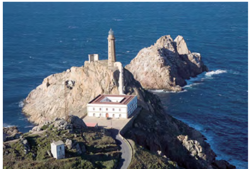
COSTA DA MORTE: 16 DE XUÑO

A viaxe transcorrerá pola zona da Fonsagrada. Realizarase a ruta de Gallol e o ascenso a Pena Guímara. A distancia a percorrer é de 15 km e está cualificada como de dificultade media-alta.