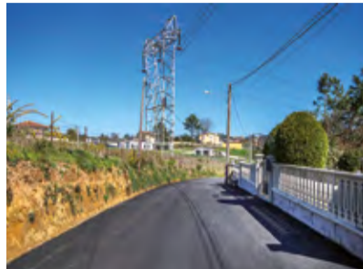
■ Rúa da Luz