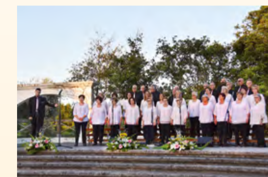
■ Para potenciar a cultura galega e a pervivencia dos nosos costumes e tradicións, as entidades culturais e as comisións de festas son subvencionadas.