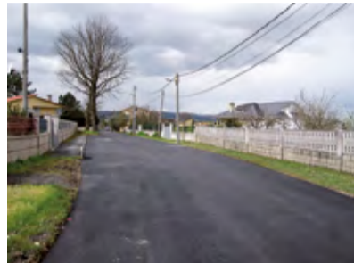
■ Rúa Laxeiro