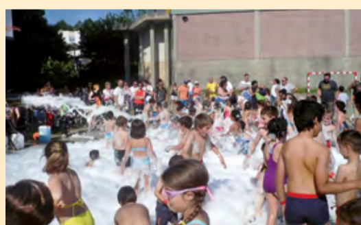
■ As ANPA levan a cabo diferentes actividades extraescolares para o alumnado dos centros de ensino públicos que reciben a axuda económica.

(*): Estas cantidades repártense en base ao número de actividades que organiza cada ANPA