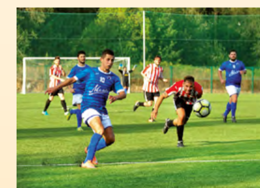
■ Os equipos de fútbol repártense outros 10.000 euros pola súa participación no Trofeo de fútbol municipal.