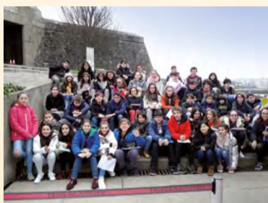
■ O Concello subvenciona as viaxes e actividades que realizan os colexios públicos.