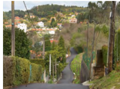
■ Rúa Curruncho