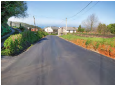
■ Rúa Tierno Galván

◆ Nas pasadas semanas, procedeuse ao asfaltado de diversas rúas do municipio. Os traballos efectuáronse na rúa Tierno Galván en Maianca, na rúa da Luz e a rúa Laxeiro en Nós, a rúa do Faro en Iñás, a rúa da Cova en Oleiros, a rúa dos Niños e a avenida das Américas en Perillo, a rúa do Campo e a rúa Castro da Vixía en Dexo e a rúa do Curruncho en Dorneda.