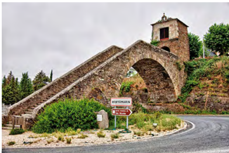
CAMIÑO DE SANTIAGO: 29 DE ABRIL

◆ O Concello de Oleiros ten programadas catro excursións a diversos lugares de Galicia e á cidade de Valencia para os vindeiros meses. En todos os casos están dirixidas a un público familiar, pero tamén poderán participar menores de idade acompañados por un adulto. Todas aquelas persoas interesadas en apuntarse poderán informarse e inscribirse persoalmente no Departamento de Cultura (A Fábrica), no teléfono 981 610 000 (extensións 4915 e 4916), ou nos enderezos electrónicos: cultura@oleiros.org e r.caparros@oleiros.org .