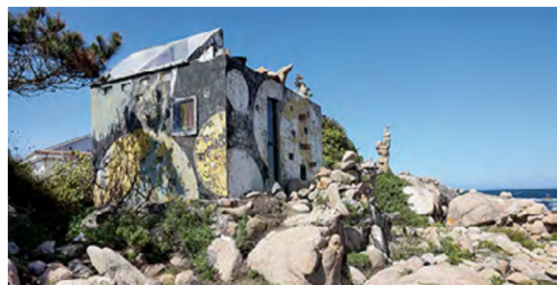
COSTA DA MORTE: 17 DE XUÑO

A viaxe transcorrerá pola zona da Fonsagrada. Visitaranse os fornos de Vilaudriz da Pontenova, A Seimeira, a fraga da Reigadas, a fervenza do Pozo da Chamosa, Vilarxubín, o bosque, o muíño e fervenza da Seimeira, Carballido, o Río Eo e a Ferrería de Bogo. A distancia a percorrer é de 16 km e está cualificada como de dificultade media.