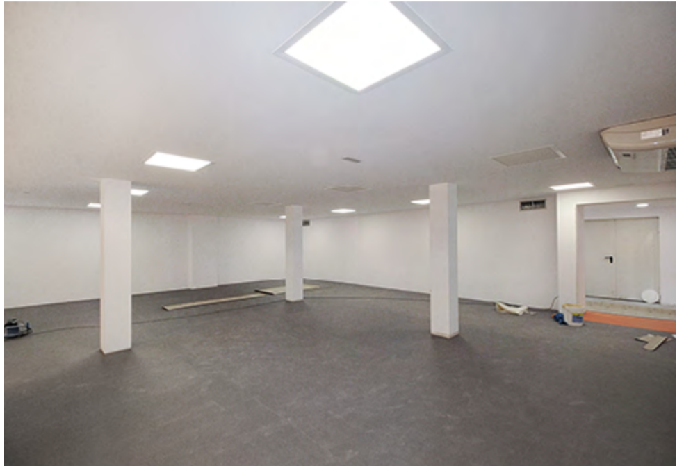
■ A ampliación da Escola Municipal de Danza xa está practicamente rematada. As obras permitirán ampliar o número de aulas de danza e albergar a Escola Municipal de Teatro.

Nos vindeiros días sairá a contratación o servizo educativo e formativo da Escola Municipal de Danza e Teatro. O importe do contrato ascende a 332.250,12 euros anuais.