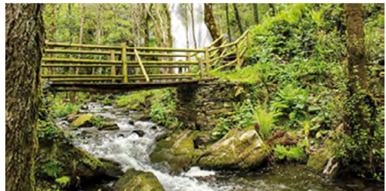
AS FRAGAS DA PONTENOVA: 27 DE MAIO

Realizarase unha ruta de interpretación ambiental e cultural polo Camiño de Santiago, no tramo entre Portomarín e Palas de Rei. A distancia a percorrer é de 25 km e está cualificada como de dificultade media.