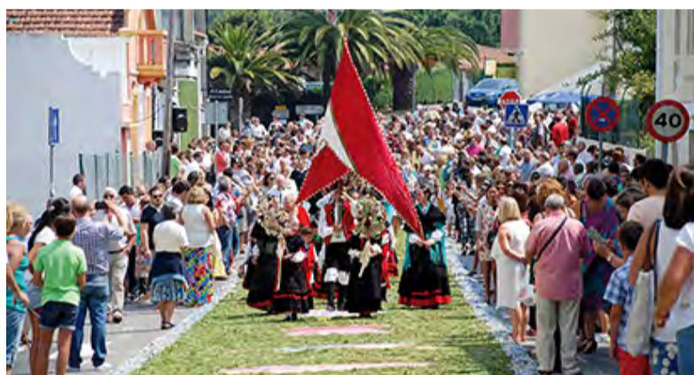
► Festas de Santa María • Oleiros, do 12 ao 16 de agosto