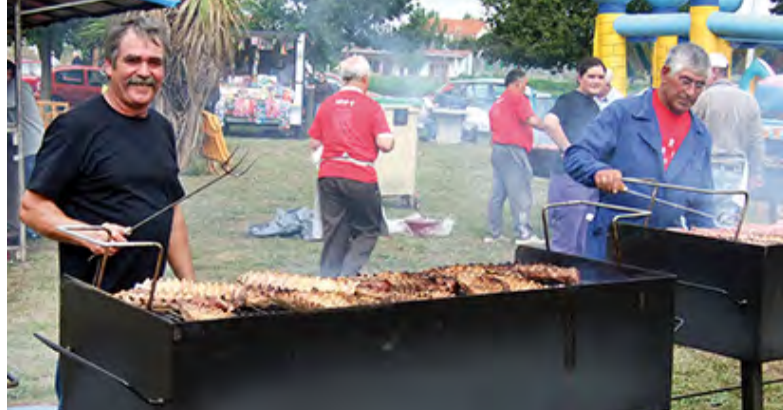
► Romaría de San Cosme • Maianca, sábado 30 de setembro