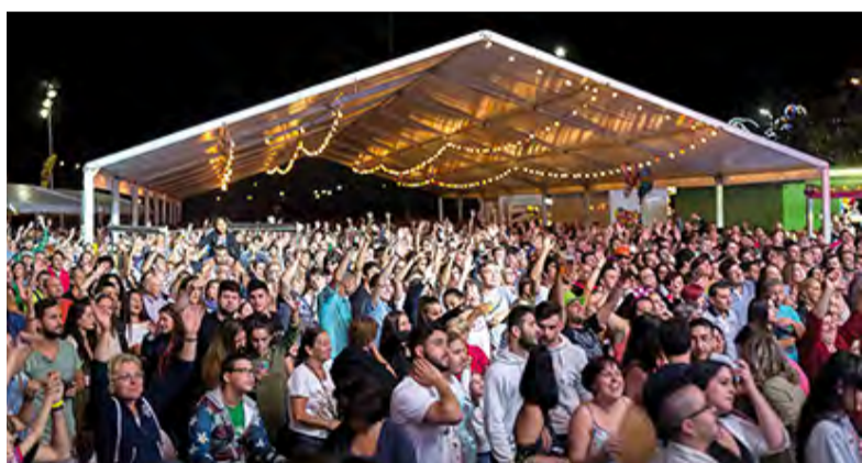
► Festas de Santa Cruz • Santa Cruz, do 18 ao 22 de agosto