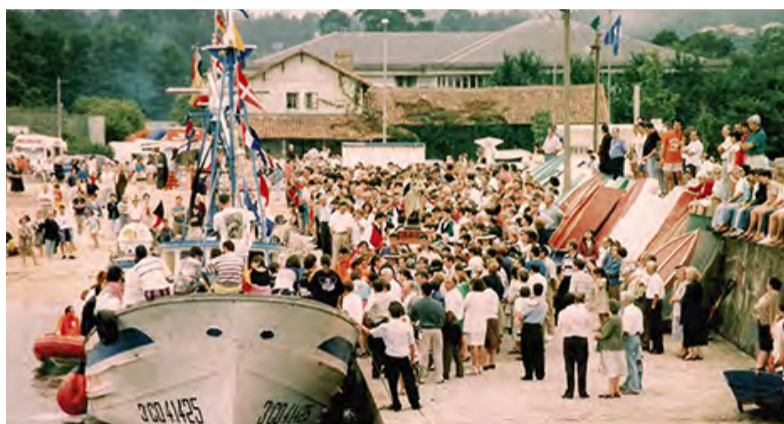
► Festas do Mar • Mera, do 14 ao 16 de xullo

◆ É de agradecer por todos os veciños, o esforzo e traballo que realizan aquelas persoas, que forman as distintas comisións de festas, e que organizan os festexos. O Concello de Oleiros tamén é parte activa de todas as festas que se celebran, cedendo espazos públicos, aportando numerosa infraestrutura e material, poñendo a disposición dos organizadores recursos humanos e redobrando esforzos para velar pola seguridade das persoas.