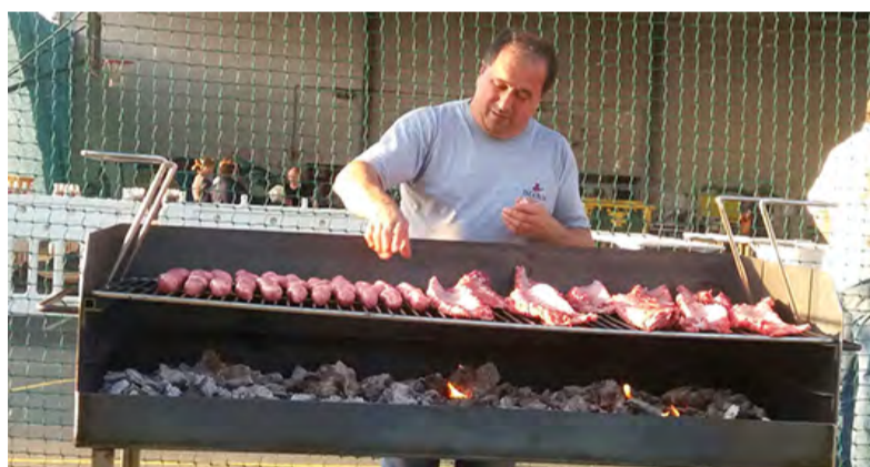
► Festas do Santísimo • Iñás, do 25 ao 27 de agosto