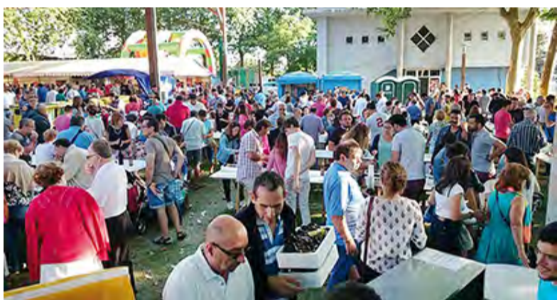
► Festas do Carme • Lorbé, do 4 ao 6 de agosto