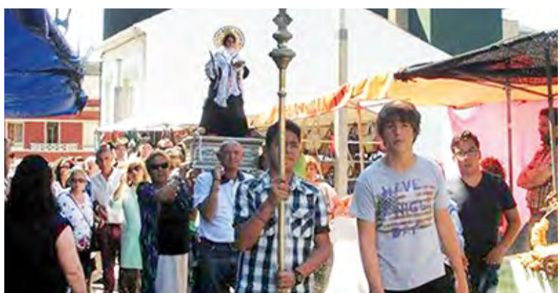
► Festas de Santa María da Cabeza • Perillo, do 1 ao 3 de setembro