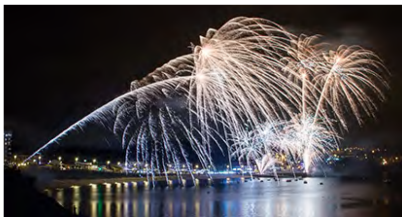
► Festas de Santa Ana • Mera, do 22 ao 27 de xullo