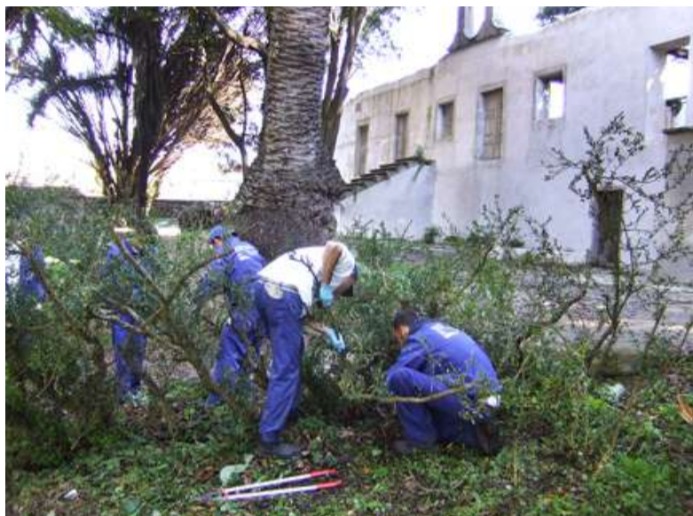
■ As persoas que aprenden viveirismo e xardinería no Centro Municipal de Formación da Carballeira realizan as súas prácticas nesta propiedade municipal

Este obradoiro de emprego conta con 6 mestres que dirixen os 20 alumnos e alumnas que están a recibir a formación necesaria para especializarse en carpintería e albanelaría. A remuneración mensual que perciben as persoas que están aprendendo é de 648,56 euros, unha cantidade que se ve incrementada no caso do profesorado e da dirección do curso.