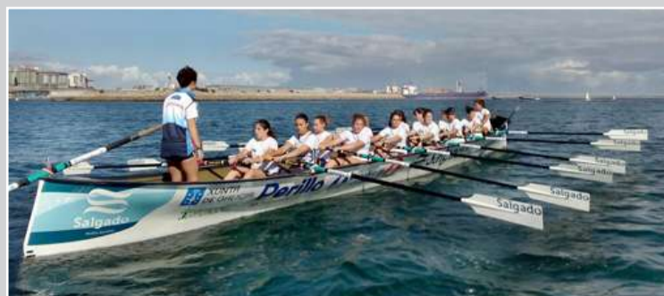
■ As mulleres do Club de Regatas Perillo durante un adestramento

Ademais, o municipio conta na actualidade con outras dúas tripulacións masculinas: a de Perillo e da Mera. Ambos equipos vogarán o vindeiro ano na mesma categoría, na Liga Galega B de traíñeiras que comezará no mes de xuño.