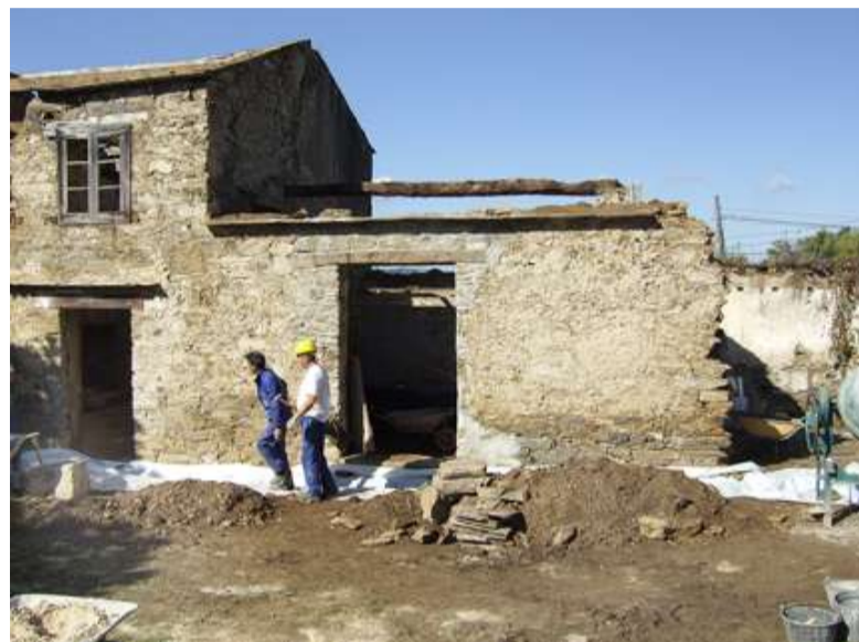
■ O alumnado do obradoiro está realizando traballos de rehabilitación no interior das edificacións