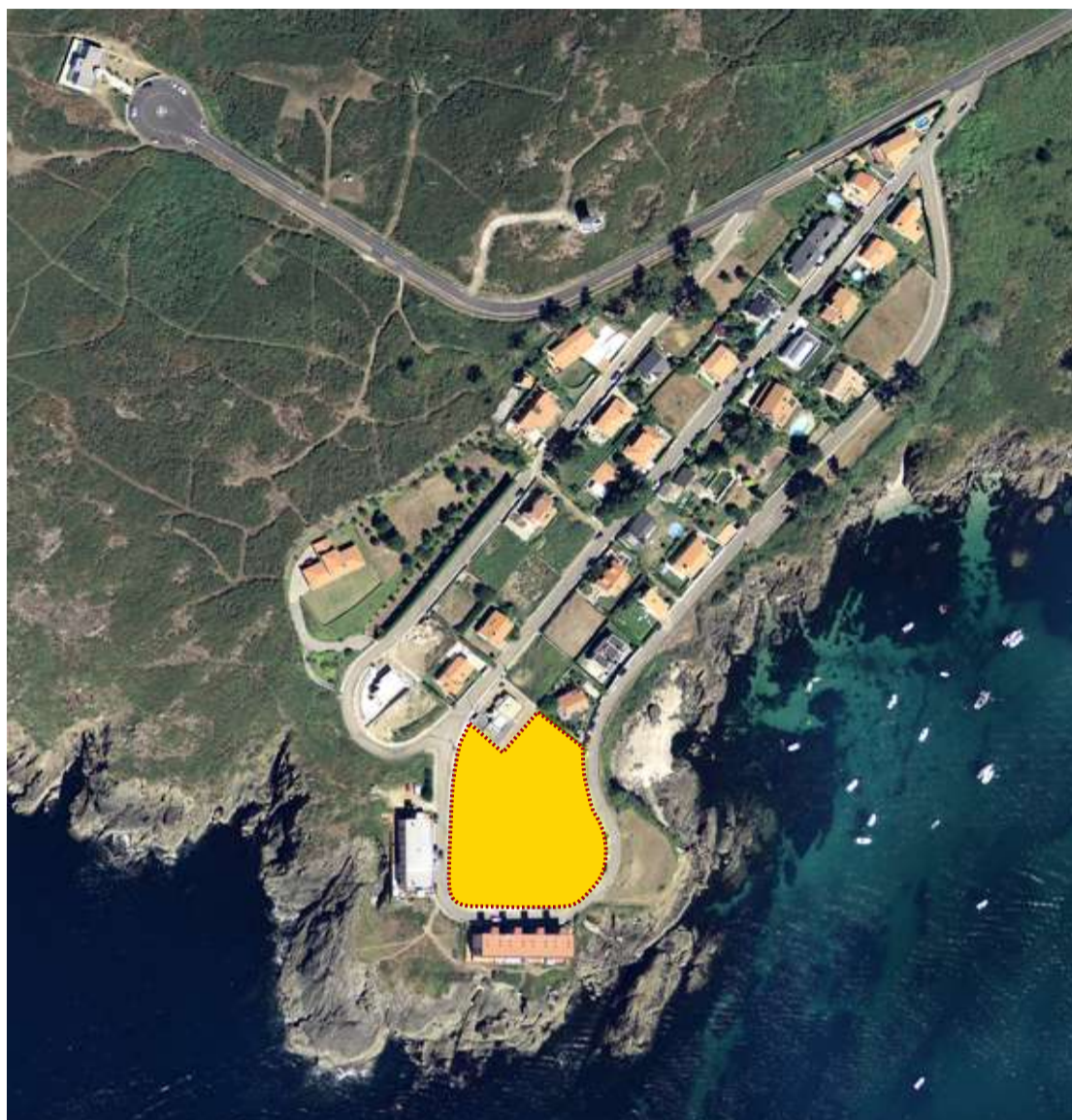
■ A parcela ten unha extensión de 4.975 metros cadrados

◆ O Concello de Oleiros está a adquirir a través de permuta os terreos que o plan parcial da urbanización O Xunqueiro ten destinados a equipamentos deportivos. A parcela, por ser dunha urbanización anterior á etapa democrática, non fora cedida ao Concello tal e como esixe a normativa urbanística. Nestes momentos, o Goberno municipal está a estudar os servizos que se poderían implantar neste fermoso lugar.