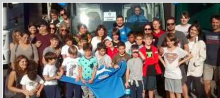
■ Xogadores, nais e pais do Hóckey Oleiros desprazados a Madrid

◆ Unha importante expedición do Hóckey Oleiros desprazouse a Madrid hai un par de fins de semana para participar no prestixioso Torneo Virgen de Europa. Os equipos oleirenses competiron nas categorías micro, prebenxamín, benxamín e alevín cuns resultados máis que satisfactorios, dada a entidade dos rivais aos que se tiveron que enfrontar. Os rapaces viviron unha experiencia única nun novo paso para continuar asentando este ilusionante proxecto deportivo.