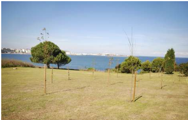
■ Conxunto de árbores atacadas no parque das Galeras

No caso do parque público de Canide, a única árbore da zona que non fora atacada apareceu co tronco roto á altura na que remataba o titor que a endereitaba e garantía o seu axeitado crecemento. Un grupo de escolares do Colexio Luis Seoane plantaron en maio varios castiñeiros nesta zona, entre os que estaba a árbore atacada.