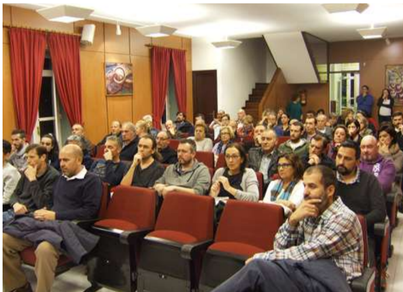
■ Reunión coas entidades o pasado ano

◆ O Servizo de Emerxencias e Protección Civil do Concello de Oleiros pasará a estar situado no polígono de Iñás, a partir dos primeiros meses de 2017. Nos últimos anos realizáronse importantes investimentos neste servizo público, fundamental para garantir a seguridade cidadá. Ante o notable incremento de vehículos e demais medios técnicos, o actual recinto da avenida Rosalía de Castro resultaba insuficiente. A nova localización tamén permite uns tempos de resposta menores ao dispoñer de mellores conexións viarias para desprazarse ás diferentes localidades do municipio.