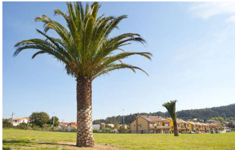
■ O Concello de Oleiros plantou neste espazo público, situado nas inmediacións da cala do Portelo, cinco palmeiras que se atopaban en Breixo e que tiveron que ser trasladadas polas obras de construción do carril bici que conectará Arillo e Mera