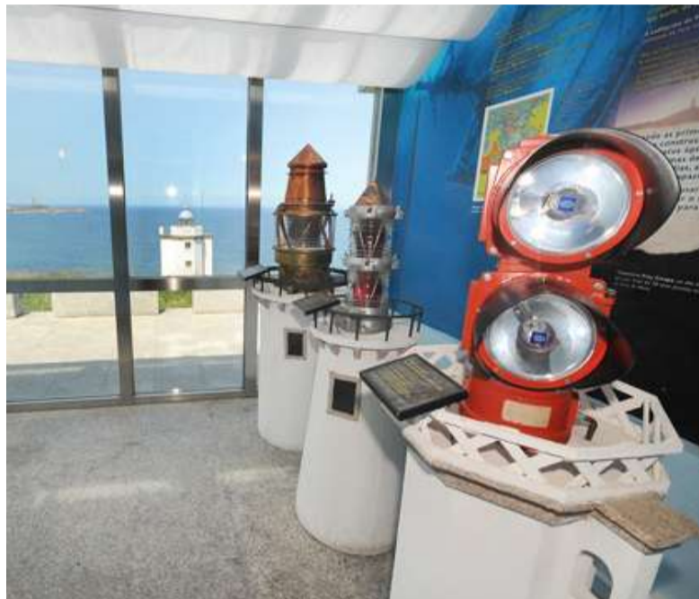
■ A Aula do Mar recibe os visitantes que se achegan ata a zona do Faro

Para este verán ofertaranse visitas guiadas polo Monumento Natural Costa de Dexo - Serantes e polo castelo de Santa Cruz. Esta actividade, na que colaborará o CEIDA, posibilitará que os turistas que se acheguen ata Oleiros poidan coñecer dun xeito máis profundo os principais atractivos turísticos existentes no municipio.