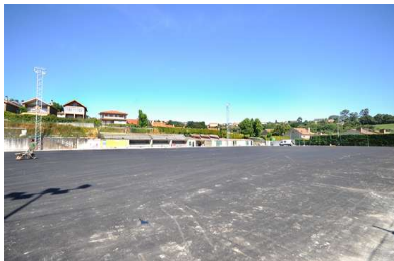
■ O campo de Montrove será o primeiro no que finalicen as obras

Unha vez rematen as obras serán catro os campos de fútbol municipais dotados de céspede artificial para a práctica deportiva. Ademais, o Concello ten previsto construír outros dous novos nas localidades de Dorneda e Mera. No caso deste último, os terreos son de propiedade municipal e xa se fixeron algunhas obras para a mellora do terreo e da futura instalación do céspede. Pola súa parte, o de Dorneda realizarase en combinación coas obras de urbanización do campo de golf.