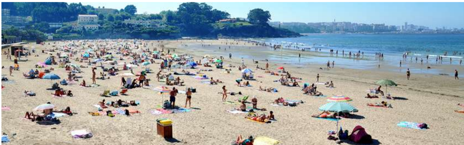
■ Bastiagueiro recibiu un pano especial polos 30 anos consecutivos de Bandeira Azul

◆ Os mellores areas da comarca atópanse en Oleiros. As praias de Santa Cristina, Bastiagueiro, Naval, Mera e Espiñeiro locen a Bandeira Azul este verán. O organismo internacional que outorga este distintivo quixo recoñecer desta maneira a calidade dos nosos areas, igual que a Xunta de Galicia que elixiu Bastiagueiro para celebrar a cerimonia de entrega dos panos. Precisamente nese acto, a propia praia de Bastiagueiro foi distinguida cunha bandeira especial por ser unha das sete praias de toda España que levan recibindo este galardón de xeito ininterrompido durante os últimos 30 anos.