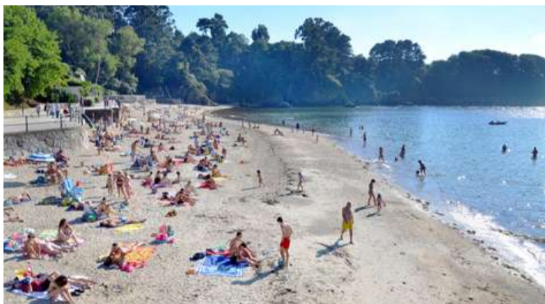
■ Os controis confirman que a praia de Santa Cruz ten unha calidade da auga excelente

O traballo serio e rigoroso que leva desenvolvido o Goberno local neste ámbito posibilita que Oleiros se atope entre os municipios galegos con máis bandeiras azuis para este 2016. Os múltiples servizos cos que están dotadas todas as praias do municipio, a calidade das augas e o excelente estado de conservación dos contornos da praias e de todo o litoral explican este importante recoñecemento. Ademais, a ordenanza do uso das praias, pioneira en Galicia, contempla unha normativa que garante a convivencia e a seguridade dos bañistas.