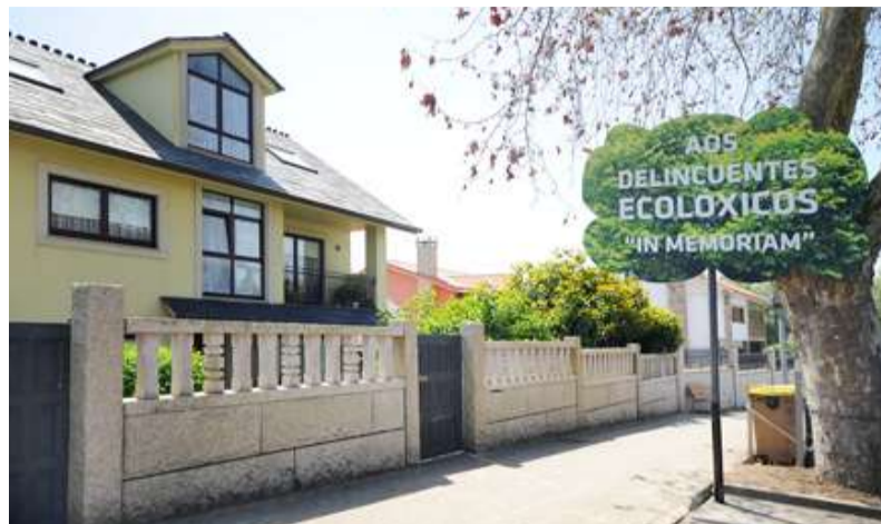
■ A árbore atacada no Carballo tiña a finalidade de adornar a antiga liña

Para denunciar estes atentados contra o patrimonio de todos os veciños e veciñas, o Concello de Oleiros instalará unha árbore de ferro no Carballo e outra nas Galeras. Con esta estrutura denúnciase a proximidade dos infractores ecolóxicos que atentan contra as árbores de todos.