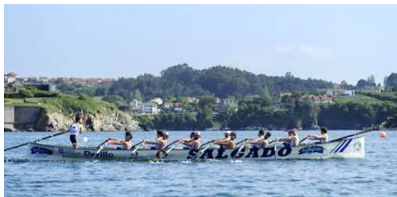
■ A regata de Perillo celebrouse o 16 de xullo e a de Mera será o 13 de agosto

A regata de Mera terá lugar o sábado 13 de agosto. O Centro Deportivo Mariñeiro de Mera organiza a III edición da súa Bandeira Baía de Mera, na que competirán as 7 embarcacións da categoría B da Liga Galega e 3 equipos femininos. O Concello tamén achega o 60% dos premios desta regata, unha axuda que neste caso ascende ata os 3.600 euros.