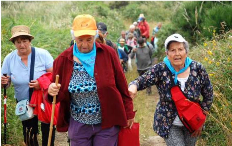
■ Os veciños e veciñas do municipio durante unha excursión

◆ O programa Ven e Descubre continúa coa súa programación de sendeirismo coas rutas dun día e as de fin de semana. As persoas que participan nesta actividade seguirán coñecendo o País dos Mil Ríos visitando o norte da provincia da Coruña coa ruta “ Entre fenicios e aves pola desembocadura do Sor e Estaca de Bares ”, na que verán as fermosas paisaxes do Barqueiro, e indagarán sobre a historia e a natureza na zona na que lindan o Atlántico e o Cantábrico.