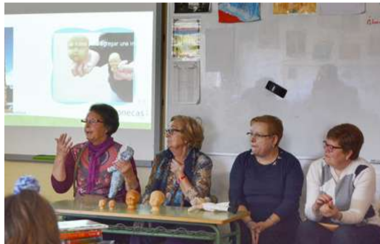
■ As alumnas do Obradoiro de Memoria de Mera impartiron clase de historia local no colexio Luis Seoane

◆ A vida activa e os hábitos saudables das persoas maiores é un dos principais obxectivos que se persegue coas actividades que oferta o Concello de Oleiros ao longo de todo o ano. Existe un amplo abano de propostas en todas e cada unha das localidades do municipio para mellorar a condición física, social e cognitiva das persoas maiores de 60 anos, unha cuestión fundamental nun proceso de envellecemento activo. Os obradoiros de ximnasia, as clases de ioga e relaxación ou os obradoiros de memoria son un claro exemplo disto. No mes de setembro retomáranse todas estas actividades, creando novos grupos nas localidades que existe unha maior demanda e ofertando tamén nos lugares onde non se facían.