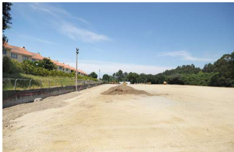
■ O investimento municipal nos Regos supera os 400.000 euros