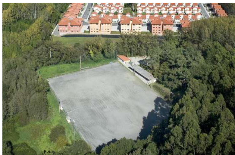
■ Con este son xa cinco os campos de fútbol municipais

◆ A petición do club de fútbol Hércules Sociedad Deportiva, que levaba a cabo a súa práctica deportiva nun campo de fútbol privado, o Concello de Oleiros presentouse á poxa que realizou a Fundación Juana de Vega para a venda deste patrimonio e adquiriuno por 36.080 euros. O citado campo, desde maio de titularidade municipal, estará a disposición do Hércules de San Pedro.