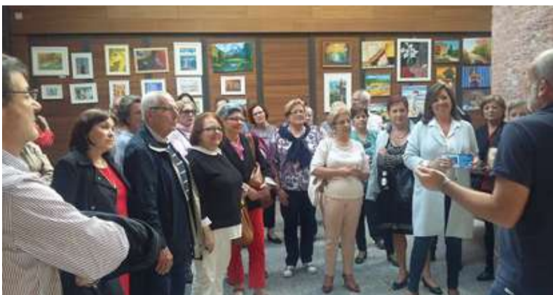
■ O alumnado de pintura expuxo as súas creacións na Fábrica

◆ Na primeira semana de setembro publicarase toda a programación das actividades ocupacionais de pintura, tapices, encaixe de palillos, manualidades e costura. Trátase dun conxunto de obradoiros de expresión artística e artesanal dirixidos a todas as persoas maiores de 18 anos de idade veciñas do Concello de Oleiros.