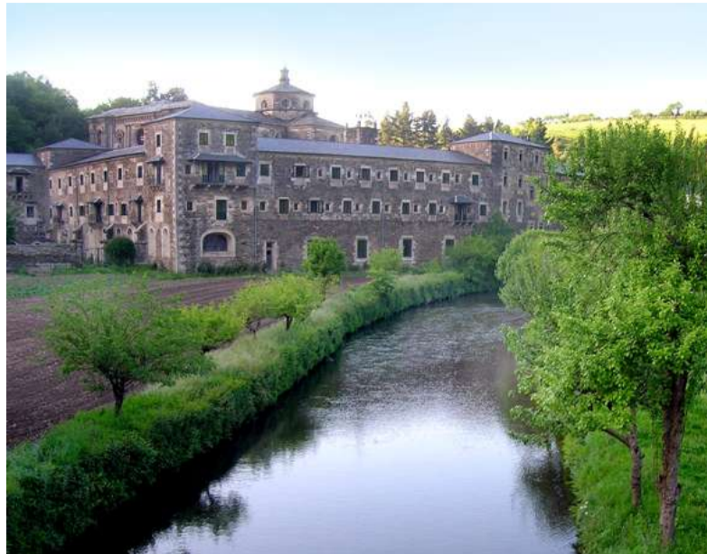
■ As persoas que participen na etapa do Camiño de Santiago poderán visitar o Mosteiro de Samos

Cada unha destas excursións ten un prezo de 16 euros para persoas empadroadas e de 20 para non empadroadas. Están dirixidas a público adulto, aínda que poden participar mozos e mozas maiores de 14 anos acompañados dun adulto. O número de prazas é limitado, tendo preferencia as persoas empadroadas no concello. As persoas interesadas en obter máis información poden chamar ao 981 610 000 ou dirixirse ao enderezo electrónico cultura@oleiros.org .