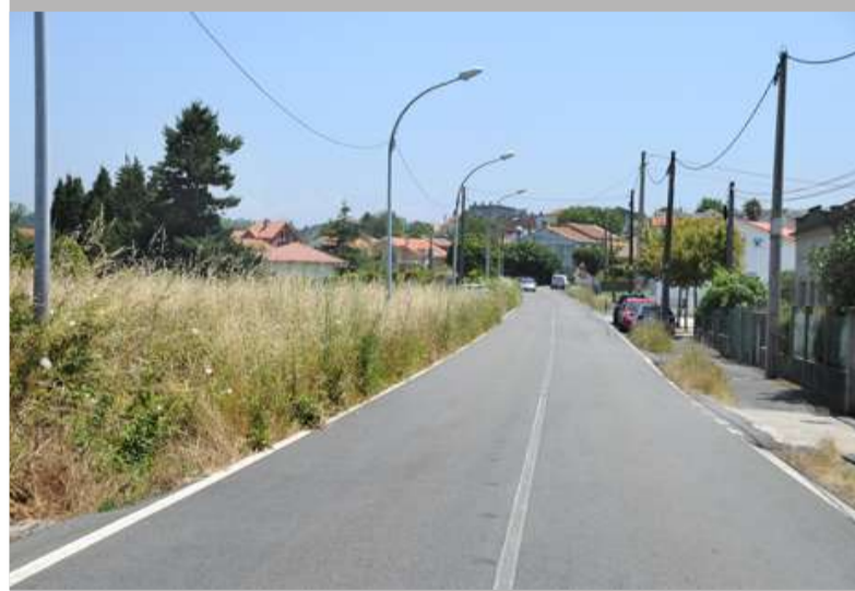
■ A avenida de Venezuela é unha das estradas nas que se acometerán estas actuacións

Tan pronto como os terreos precisos para realizar as beirarrúas na avenida de Venezuela, na estrada de Lñás e na estrada da Besta - que conecta o centro de Mera coa vía Ártabra- pasen a disposición municipal, a Deputación da Coruña abordará as obras. Uns proxectos que no caso de Mera, ademais da creación das beirarrúas, implicará a ampliación da estrada que pasará a ter 7 metros de ancho.