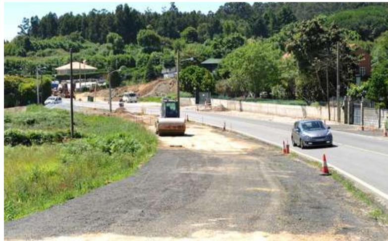
■ O gran paseo que existirá desde Perillo ata Mera encherá de vida o municipio

O custo desta segunda fase das obras supera o millón de euros e estará financiado pola Deputación da Coruña. O Concello inciou a primeira fase do proxecto con fondos municipais (900.000 euros), malia que sería a Xunta de Galicia a administración que debería realizar a obra por ter a titularidade sobre esa estrada. Os veciños e veciñas cederon gratuitamente os terreos para que a creación destes accesos fose posible.