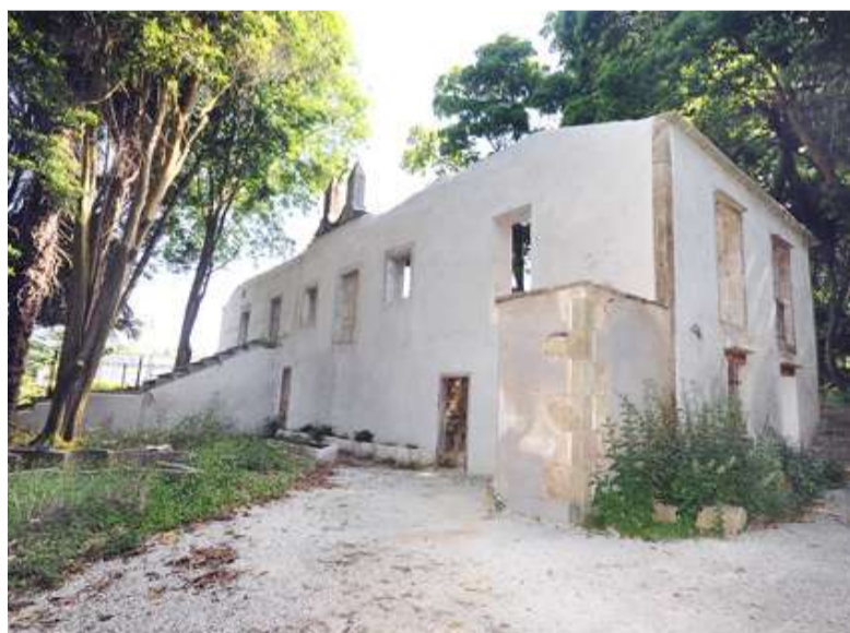
■ Está previsto que as tarefas do obradoiro comecen no mes de setembro

Nesta ocasión, o alumnado do obradoiro participará nas especialidades de carpintería e albanaría. Dese xeito poderase dar un paso máis na recuperación do edificio principal da finca, unha auténtica xoia arquitectónica. Ademais, as persoas que aprenden viveirismo e xardinería no Centro Municipal de Formación da Carballeira realizarán as súas prácticas nesta propiedade municipal.