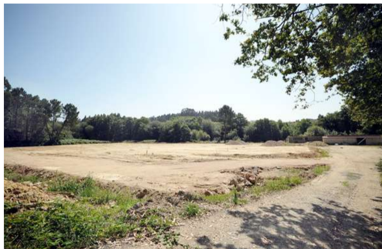
■ A construción dos vestiarios e do peche en Iñás poderá realizarse cunha subvención da Deputación