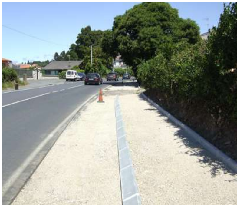
■ As obras, desde Santa Cruz ata Abeleiras, continuarán nas próximas semanas

◆ Completada xa a primeira parte das obras de construción de beiravías na estrada de Meirás, no tramo que vai desde Abeleiras de Arriba ata Os Tornos, os traballos proseguirán durante as vindeiras semanas entre o cruce de Abeleiras e Santa Cruz. A creación desta importante infraestrutura para a seguridade viaria das persoas realizarase a ambas marxes da estrada, dándolle continuidade ás zonas nas que xa hai beirarrúas. O investimento total deste proxecto, sumando todas as actuacións realizadas, é de 300.000 euros.