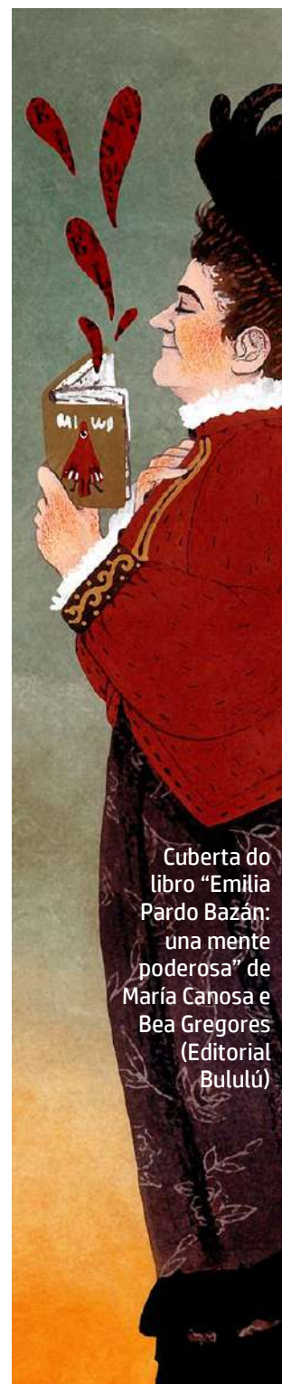
Cuberta do libro “Emilia Pardo Bazán: una mente poderosa” de María Canosa e Bea Gregores (Editorial Bululú)

El 29 de mayo de 1912 Emilia Pardo Bazán escribió una carta de tres folios donde enumeraba sus méritos para entrar en la Real Academia Española: presidenta o socia de unas 50 entidades culturales y autora de más de 50 obras, muchas traducidas y alguna estudiada en liceos franceses. “Creyéndose con títulos suficientes para ocupar una de las plazas vacantes en la Real Academia Española, respetuosamente la solicita”, concluía la escritora. Aunque la controversia sobre su entrada no era nueva, esta vez la institución se vio forzada a dar una respuesta. En el