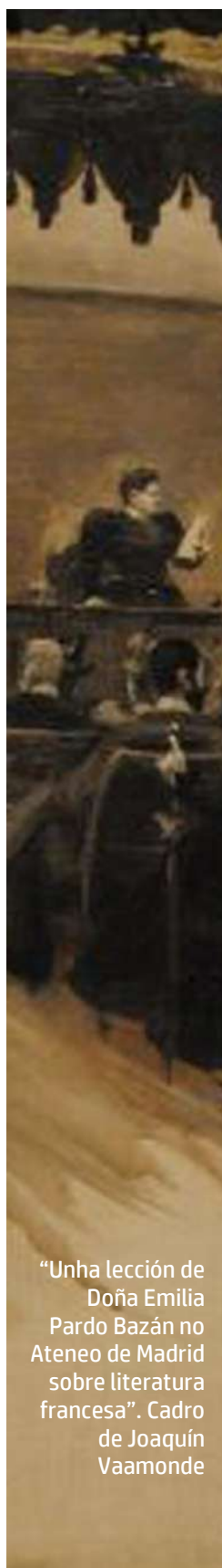
“Unha lección de Doña Emilia Pardo Bazán no Ateneo de Madrid sobre literatura francesa”. Cadro de Joaquín Vaamonde