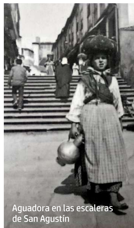
Aguadora en las escaleras de San Agustín

Los oficios ¿A qué se dedicaban? La escritora cuenta en la novela que el trabajo estaba mal visto entre los residentes en el Barrio de Arriba, donde se asentaban la nobleza y la aristocracia. Entre los habitantes de otras zonas de la ciudad abundaban pescadores, comerciantes y gentes que desempeñaban variedad de oficios. La actividad fabril se concentraba en la Fábrica de Tabacos, que, según la Pardo Bazán, empleaba ya por entonces a 4.000 cigarreras. Pescantinas, mandaderas (mujeres que transportaban en carretillas los baúles de los emigrantes), lecheras, piñeras, aguadores, afiladores, zapateros o saludadoras (curandera que empleaba jaculatorias y fórmulas mágicas para, por ejemplo, levantar la paletilla) eran algunas de sus ocupaciones.