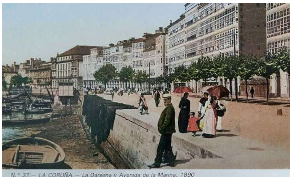
N.º 37.— LA CORUÑA.— La Dársena y Avenida de la Marina. 1890

https://elpais.com/cultura/2021-05-09/cien-anos-de-morrina-por-emilia-pardo-bazan.html