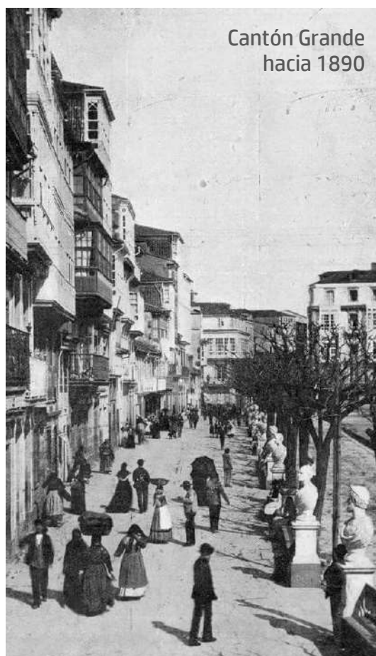
Cantón Grande hacia 1890

¿Aparece esta denominación en otras obras de la autora? La descripción de Marineda se inicia en La Tribuna , se completa en De mi tierra , La piedra angular , Memorias de un solterón y en Doña Milagros y se amplía en las novelas cortas La dama joven y Rodando , así como en Cuentos de Marineda .