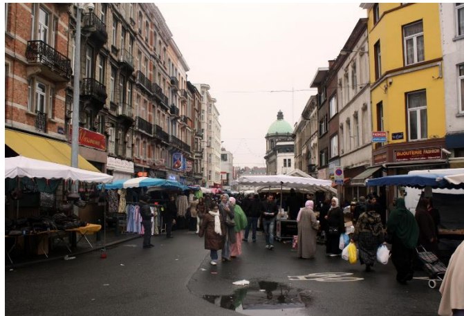
Rúa no barrio de Molenbeek