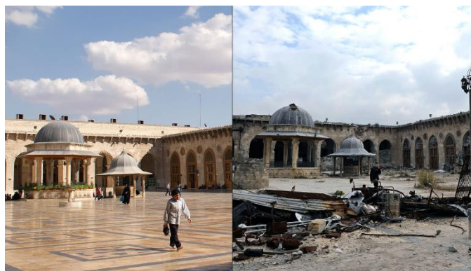
Mesquita omeya de Alepo, antes e despois do conflito.