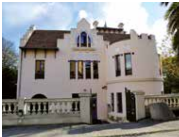
BIBLIOTECA CENTRAL RIALEDA Avda. Rosalía de Castro, 227A 15172 PERILLO ☎ 981 639 511