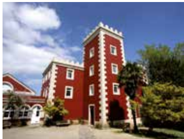
BIBLIOTECA PÚBLICA MUNICIPAL E CENTRO DE DOCUMENTACIÓN DA MULLER ROSALÍA DE CASTRO Centro Cultural As Torres. Rúa Emilia Pardo Bazán, nº17 SANTA CRUZ - 15179 Liáns