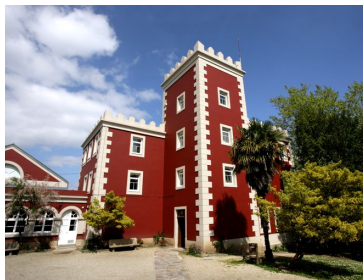
BIBLIOTECA PÚBLICA MUNICIPAL E CENTRO DE DOCUMENTACIÓN DA MULLER ROSALÍA DE CASTRO Centro Cultural As Torres. Rúa Emilia Pardo Bazán, nº17 SANTA CRUZ - 15179 Liáns