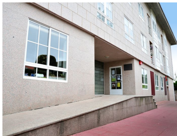
BIBLIOTECA PÚBLICA MUNICIPAL MANUEL MARÍA Rúa Camilo Díaz Baliño, nº1 15173 OLEIROS