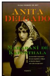
Anita Delgado, Maharani de Kapurthala