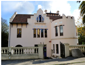
BIBLIOTECA CENTRAL RIALEDA Avda. Rosalía de Castro, 227A 15172 PERILLO