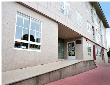
BIBLIOTECA PÚBLICA MUNICIPAL MANUEL MARÍA Rúa Camilo Díaz Baliño, nº1 15173 OLEIROS