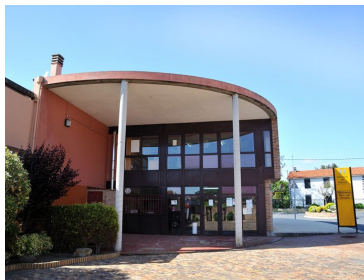
BIBLIOTECA PÚBLICA MUNICIPAL Mª JOSÉ TRINCADO A Lagoa (Urbanización Pía de Maianca). R/ Curros Enríquez, nº44 15177 MERA