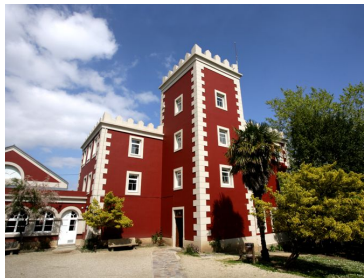
BIBLIOTECA PÚBLICA MUNICIPAL E CENTRO DE DOCUMENTACIÓN DA MULLER ROSALÍA DE CASTRO Centro Cultural As Torres. Rúa Emilia Pardo Bazán, nº17 SANTA CRUZ - 15179 Liáns