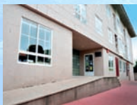
BIBLIOTECA PÚBLICA MUNICIPAL MANUEL MARÍA Rúa Camilo Díaz Balaño, nº1 15173 OLEIROS