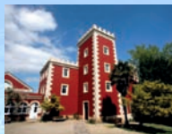
B. P. M. E CENTRO DE DOCUMENTACIÓN DA MULLER ROSALÍA DE CASTRO Centro Cultural As Torres, Rúa Emilia Pardo Bazán, nº17 SANTA CRUZ - 15179 Liáns