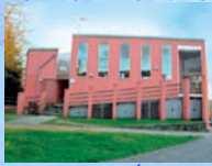
BIBLIOTECA PÚBLICA MUNICIPAL ÁNXL FOLE Casa do Pobo. Praza da Liberdade, nº1 15176 NOS