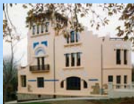
BIBLIOTECA CENTRAL RIALEDA Avda. Rosalía de Castro, 227A 15172 PERILLO