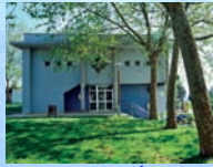
BIBLIOTECA PÚBLICA MUNICIPAL XOGRAR MENDIÑO Casa do Pobo. Rúa do Golfiño, nº38 LORBE - 15177 Dexo