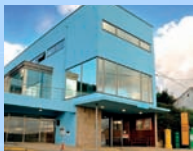
BIBLIOTECA PÚBLICA MUNICIPAL FEDERICO GARCÍA LORCA Casa do Pobo. Avda. Rosalía de Castro, nº56 MONTROVE - 15179 Liáns