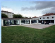
BIBLIOTECA PÚBLICA MUNICIPAL Mª JOSÉ RUSO Parque Nicolás Redondo. Rialta. Ariño 15178 DORNEDA