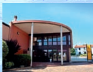
BIBLIOTECA PÚBLICA MUNICIPAL Mª JOSÉ TRINCADO A Lagoa (Urbanización Pía de Maianca), R/ Curros Enríquez, nº44 15177 MERA