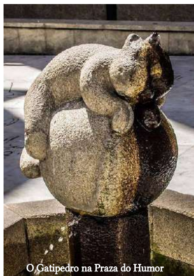
O Gatipetro na Praza do Humor