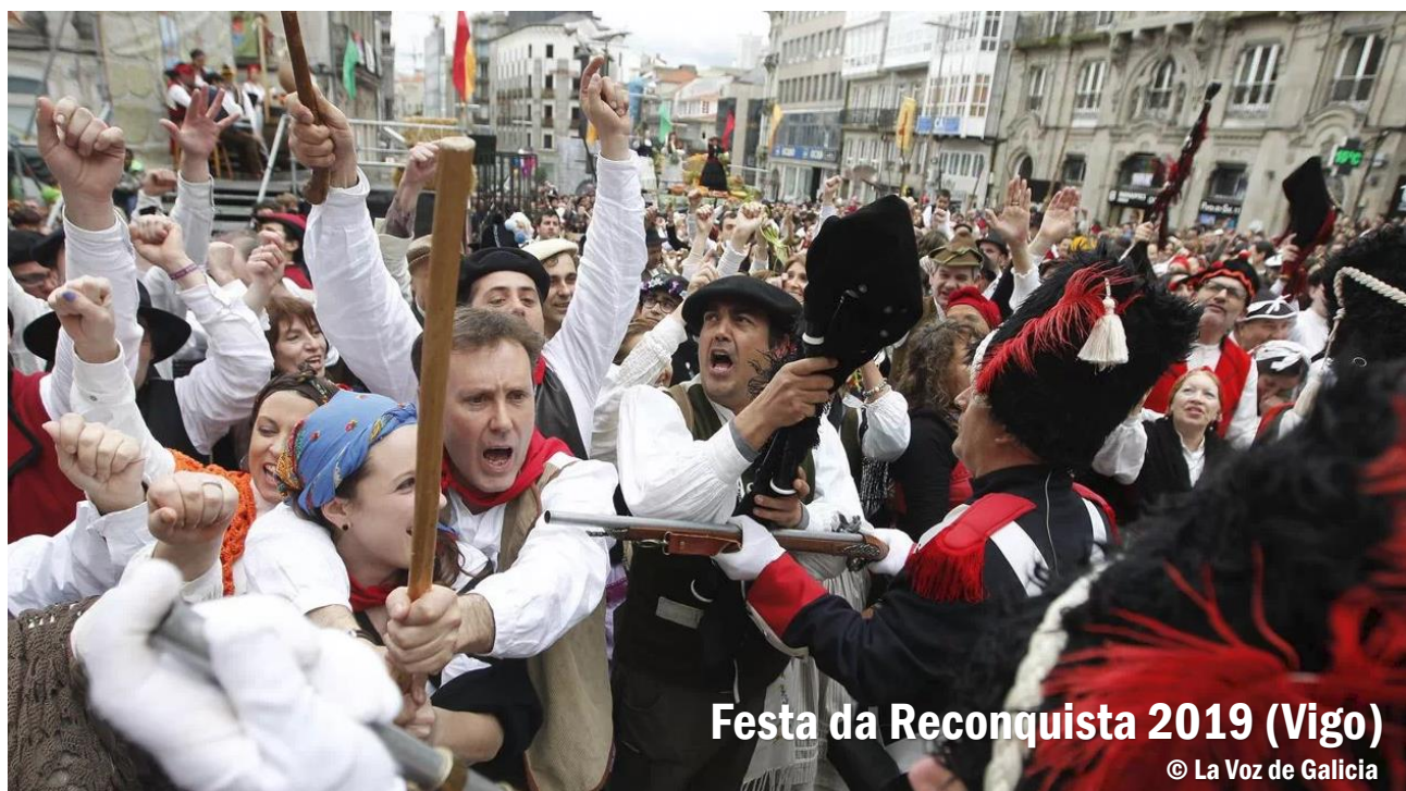
Festa da Reconquista 2019 (Vigo)

Tñaño moi claro. Nas miñas novelas sempre tento enganchar o lector desde o primeiro momento. Busco chamar a súa atención e mantela ao longo de toda a trama ata a última palabra da última páxina. E para esta ocasión, onde imos acompañar, entre outras, á figura dun alcalde determinante para comprender a historia da cidade, como foi Vázquez Varela, que mellor maneira de impactar na atención do lector que asasinando o “mediático alcalde” César Escudeiro?