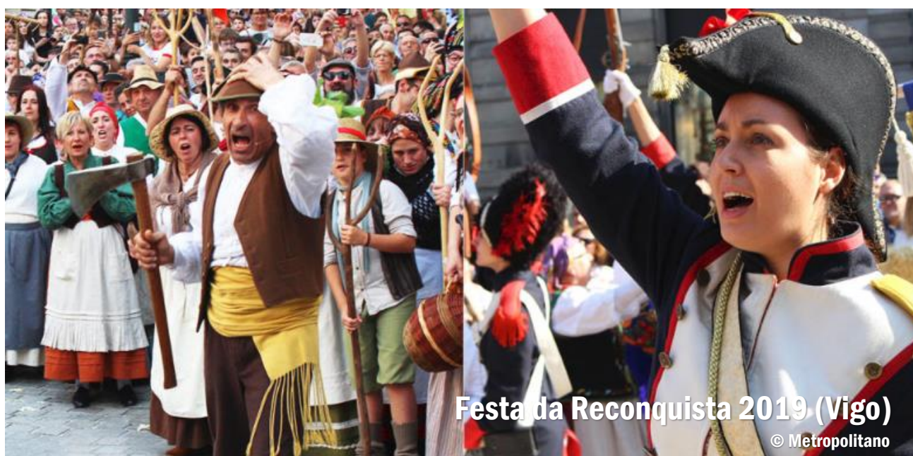
Festa da Reconquista 2019 (Vigo)