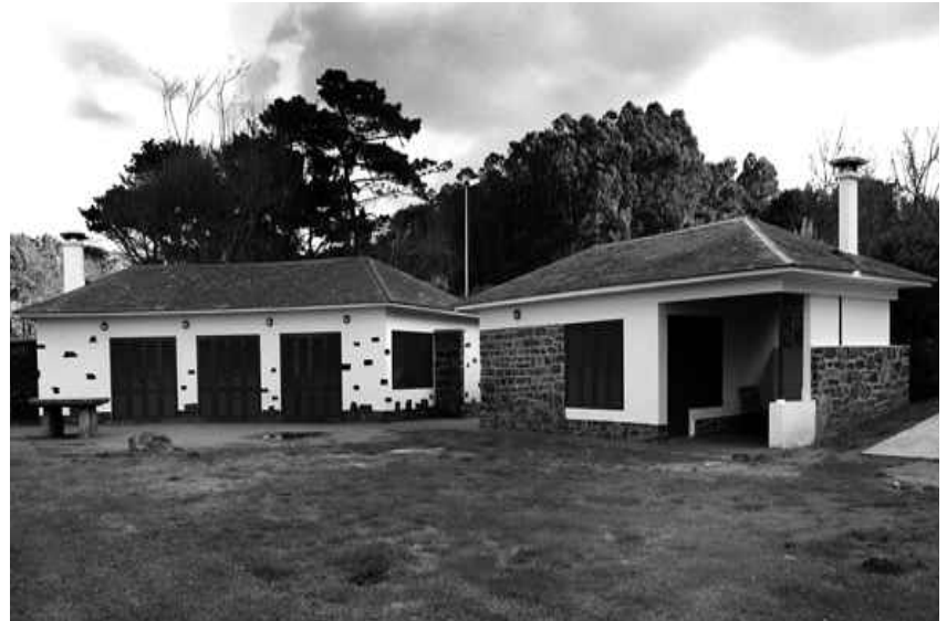
■ Casa da Silva

Estas normas estanse a cumprir pola inmensa maioría dos veciños e veciñas, con algunha excepción, polo que o Goberno local insiste na necesidade de cumprir as obrigas para que toda a poboación teña a posibilidade de usar estas instalacións sen que o Concello teña que verse obrigado a cobrar unha taxa por este servizo gratuíto do Concello de Oleiros e que se continúe a gozar da convivencia e se contribúa ao incremento da vida social no municipio.