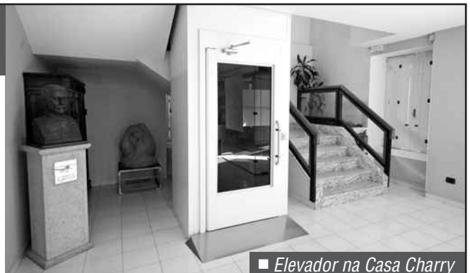
■ Elevador na Casa Charry