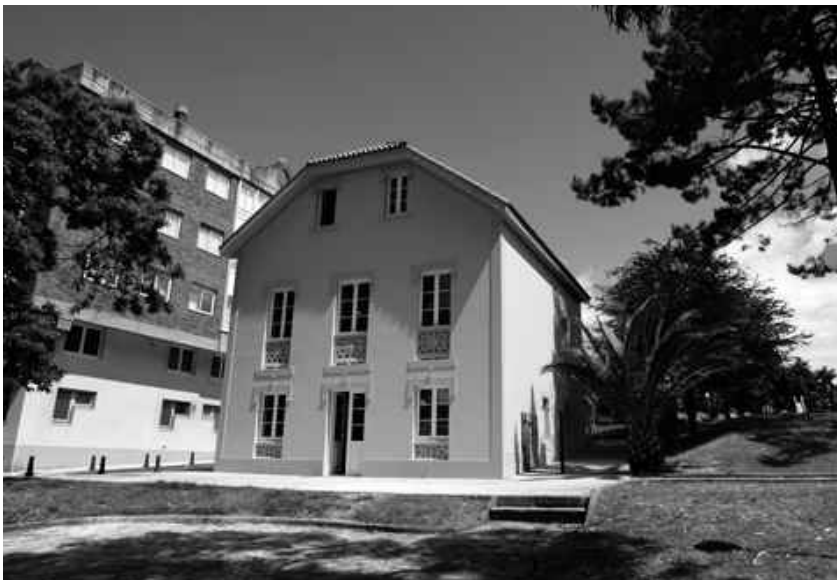
■ Casa Agramar