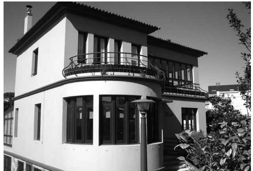
■ Casa Echeverry