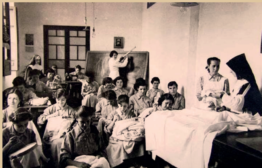
▼ Fotografías do fondo persoal de Salomé da Torre.