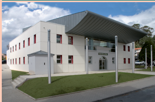
Rúa do Chelito, s/n. Mera/Serantes