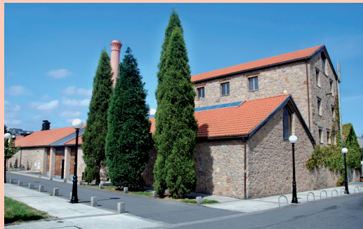
Rúa do Inglés, nº 13. Perillo