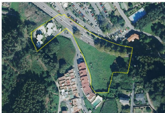
Localización da modificación puntual