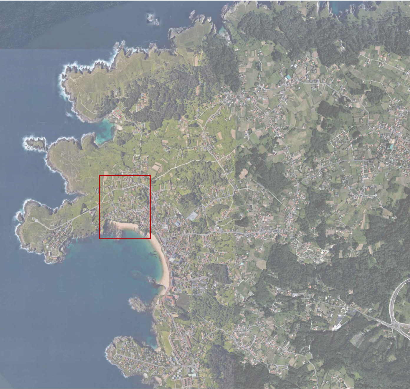
Ubicación sobre fotografía satelital