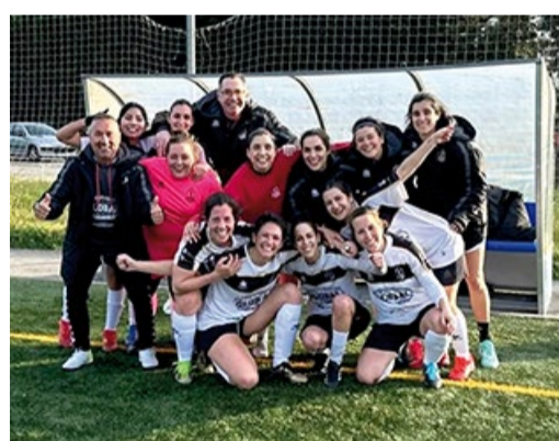
■ FÚTBOL Xuventude de Dorneda, campioas de liga F7 A Coruña