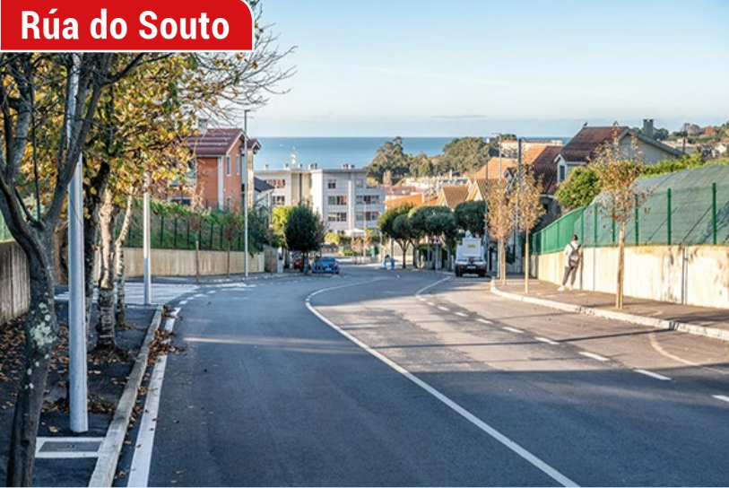
Rúa do Souto