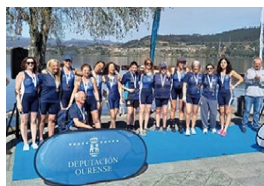
■ REMO CDM Mera, medalla de bronce no Campionato galego de traíneiras de longa distancia en veteranas