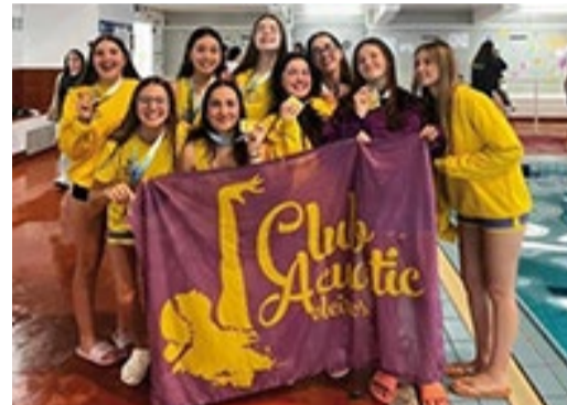
■ NATACIÓN ARTÍSTICA Club Acuatic Oleiros, campioas galegas