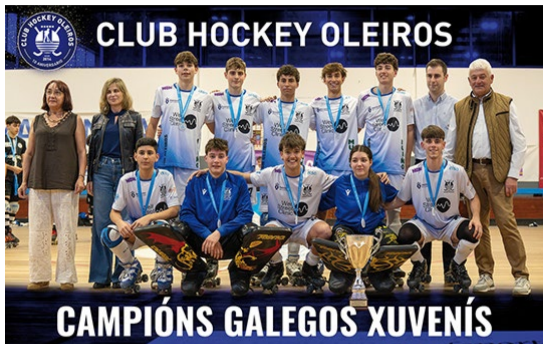
■ HOCKEY Club Hockey Oleiros, campións galegos xuvenís