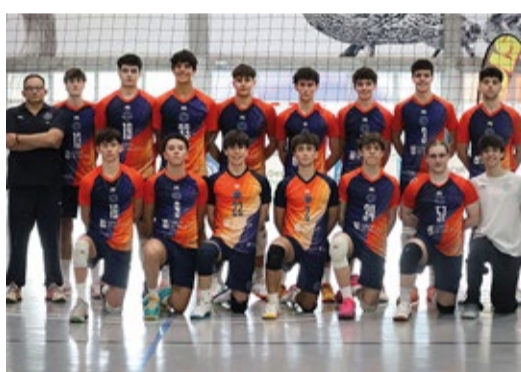
■ VOLEI Club Voleibol Oleiros, subcampioas e subcampións galegos en categoría junior