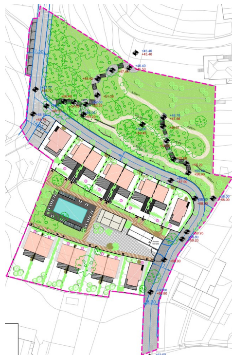
Extracto do plano de ordenación PORD_05IMX (non vinculante)

Prevese resolver o abastecemento do ámbito mediante a conexión coas redes existentes na avenida Valle Inclán (ao sur) e na rúa do Romeu (ao oeste). A rede de saneamento de augas fecais conectarase coa rede que discorre pola rúa dos Niños (ao norte), aproveitando a pendente do terreo. As augas pluviais serán conducidas a un depósito de infiltración, con reboseiro conectado á rede de fecais.