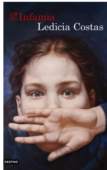
Cuberta da versión en castelán

https://www.zendalibros.com/meterse-en-las-tripas-de-la-trama/