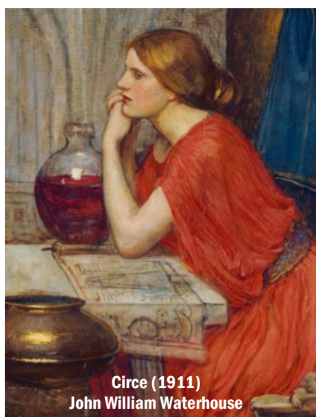
Circe (1911) John William Waterhouse