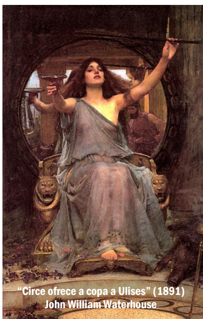
"Circe ofrece a copa a Ulises" (1891) John William Waterhouse