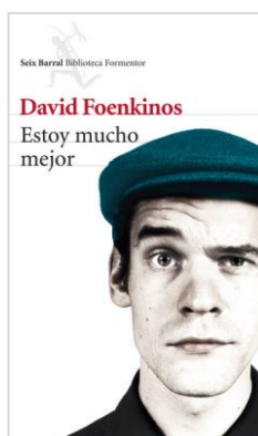
Estoy mucho mejor