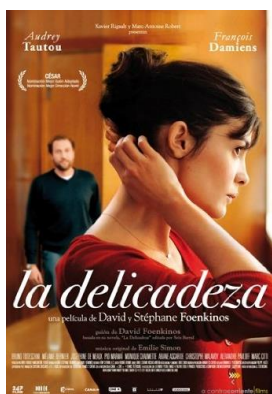
La delicadeza (dvd)