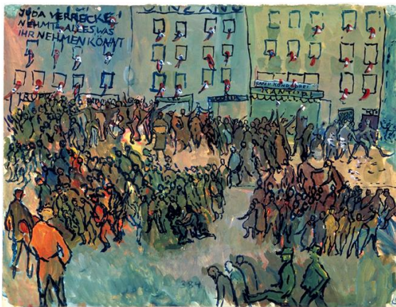
Charlotte Solomon "Kristallnacht" (1938)

vida en los que la cosa no estaría funcionando muy bien. Después vino Lennon , una biografía de John narrada por él mismo, en un gesto de audacia y arrojo temerarios (¡escribir en primera persona como Lennon!) pero muy lograda, que termina tocando algo muy puro del nervio central de lo que podríamos llamar “lo beatle”. Y ahora llega Charlotte , seguramente el más fuerte de sus libros y en varios sentidos el más ambicioso.