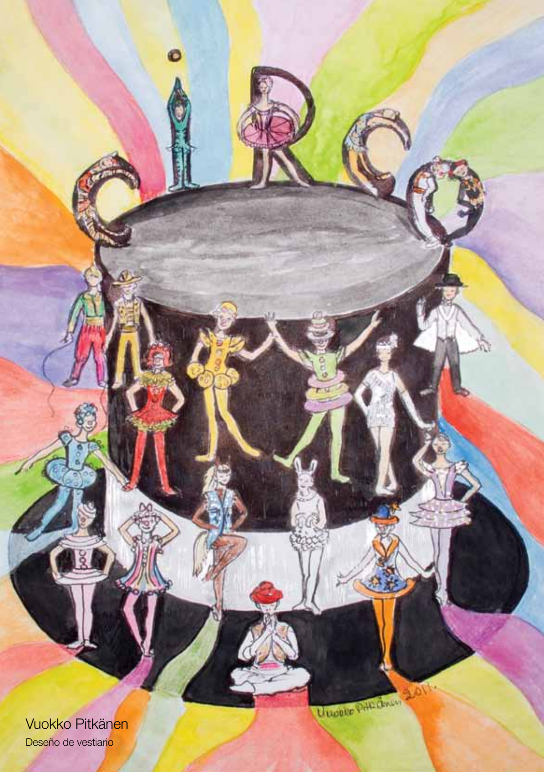
Vuokko Pitkänen Diseño de vestuario