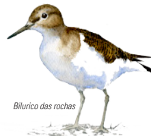
Bilurico das rochas

Na beira camiña co seu incesante balanceo o bilurico das rochas , mentres algunha garza real permanece inmóbil á espera dalgunha presa.