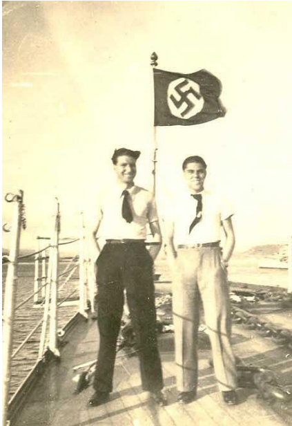
Buque nazi atracado en Vilagarcía

carné nin un policía ao uso, caín na conta de que o Reina da miña anterior novela lle acaía a esta. Como ves, escribir consiste, ademais doutras lerias, en tomar moitas decisións.