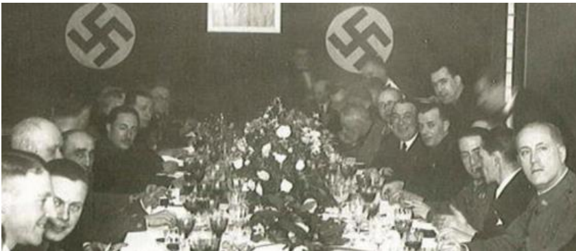
Reunión no Fogar Alemán da Rúa Príncipe de Vigo

protagonista perspicaz virado cara á acción. En fin, todo o que son personaxes do pasado teñen o aquel de estudo que ao mellor ata pasa desapercibido. Por poñerche un exemplo: os dous represores que collen ao sancristán pola noite no seu coche para ir facer das súas polo Cabo do Mundo existiron en realidade, e con eses mesmos nomes.