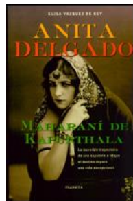
Anita Delgado, Maharani de Kapurthala