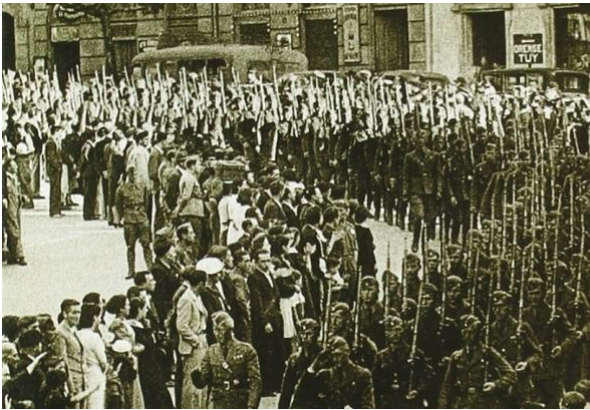
Desfile da Lexión Cóndor en Vigo

Ademais del, moitos fascistas da vila lévanse moi ben cos nazis. De igual xeito que a Igrexa (o mosteiro), ten moi boa relación co franquismo. Nestes retratos que fas, apuntas máis que a afinidades persoais. Digo porque se ten discutido se nazismo e fascismo á española son moi diferentes ou non... Na túa novela non o parecen.